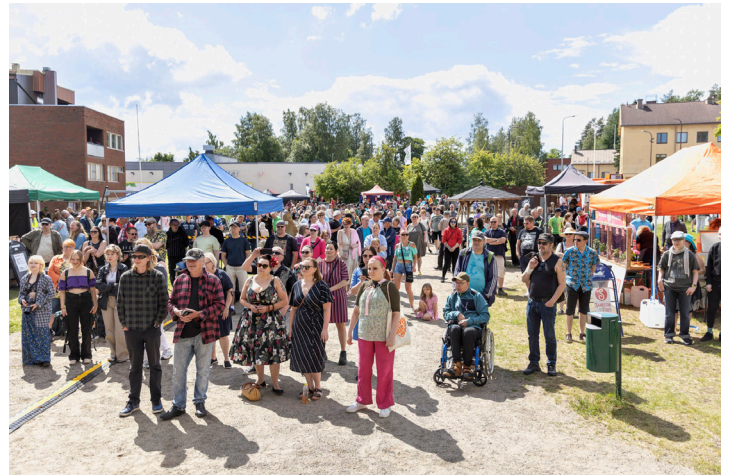
Kuvat Irma Lehtikoinen