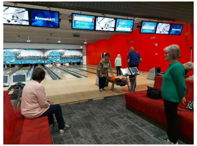
Liikuntalajikokeilu Joensuun Kuntokeitaalla