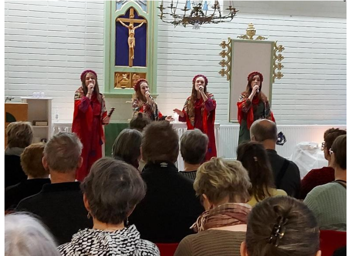
Ukrainalainen viihdekonsertti; Nota Neo seurakuntatalolla. Mukana yhteistyössä.