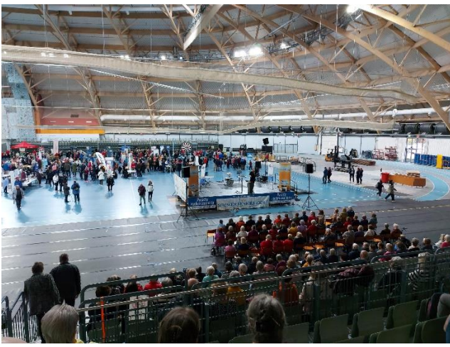
Ikäihmisten terveystapaaminen Areenalla