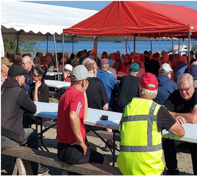
Rantakalapäivä Kallioniemen grillikodalla