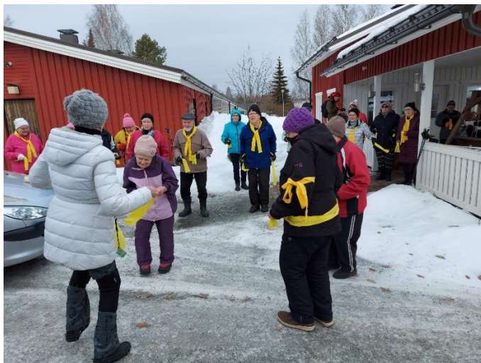
Keltaisen nauhan päivä yhteistyössä Reuma ja Tuleksen kanssa Koivikon Pirtissä