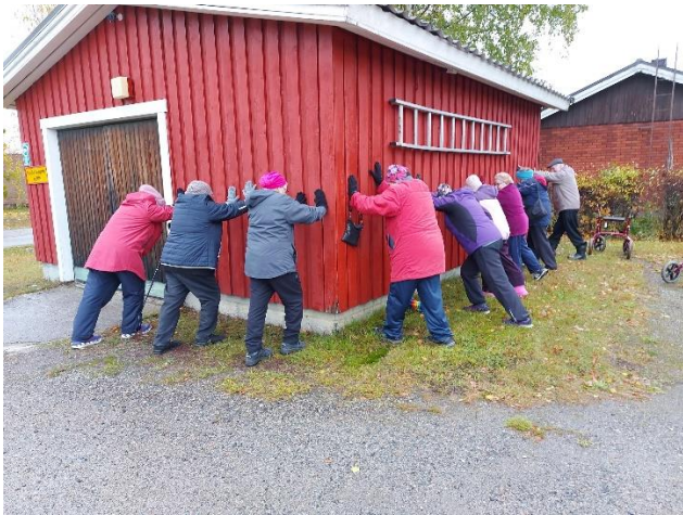
Valtakunnallinen Ikäihmisten ulkoilupäivä Koivikon Pirtissä