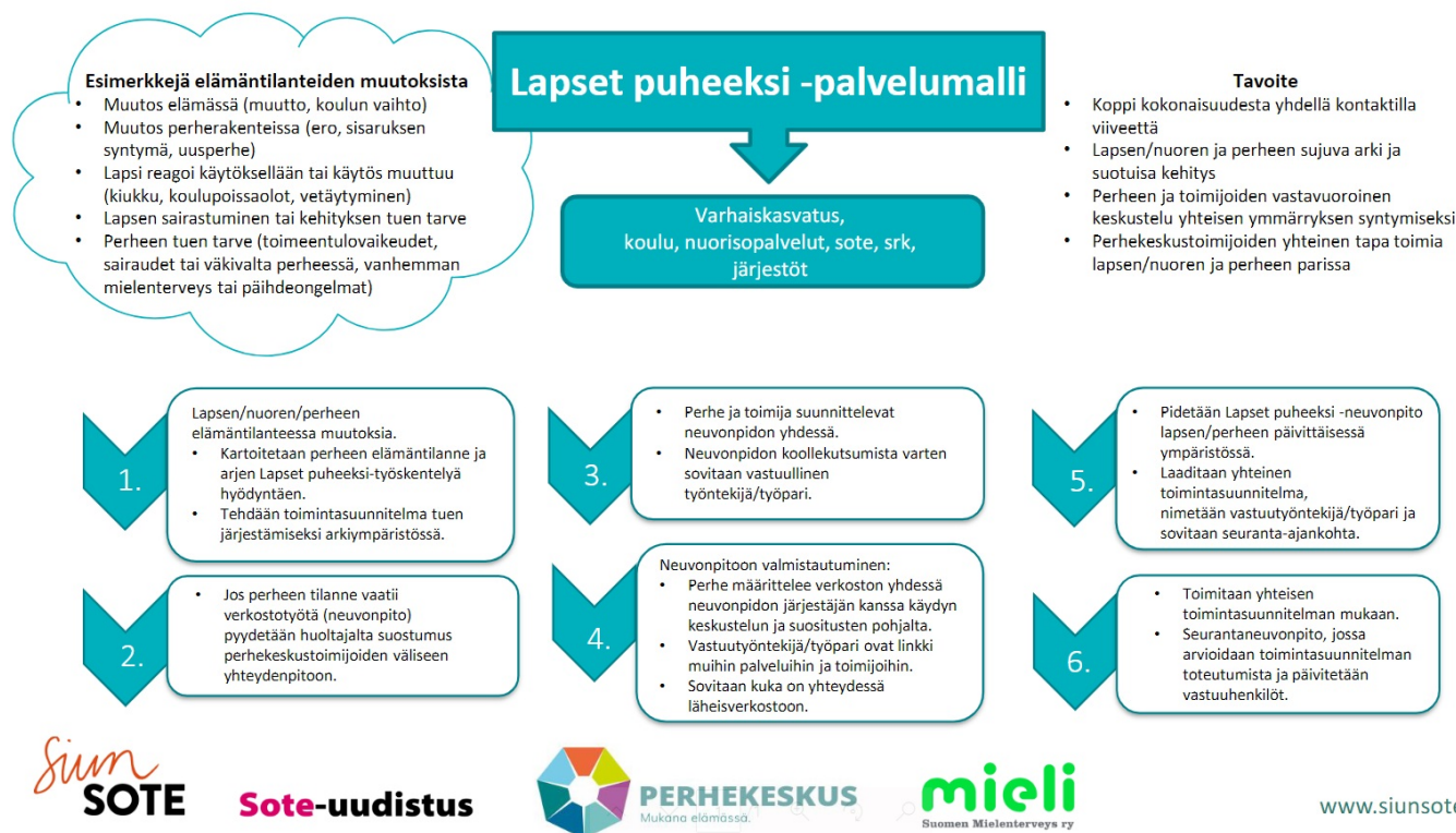
Kuva 2. Lapset puheeksi – palvelumalli

Lapsen, nuoren ja perheen eri toimintaympäristöissä tai terveystarkastuksissa voidaan havaita tarvetta yhteistyölle kuntoutuksen ja muiden ammattiryhmien kanssa. Yhteistyön tarve voi herätä lapsen kehityksestä, taidoista tai käytöksestä. Eri ammattilaisten työlle on laadittu kriteereitä ja työohjeita, joiden perusteella asiakasta voi ohjata palveluihin. Lisäksi voi tulla tilanteita, että tarvitaan konsultaatiota, jossa LP-palvelumalli voi olla apuna. Siun soten kuntoutuksen ammattilaisia työskentelee laajasti lähes kaikissa sosiaali- ja terveydenhuollon palvelu- ja asiakasprosesseissa. Kuntoutuksen työntekijät toteuttavat työtään perhekeskusverkoston moniammatillisen tiimin jäsenenä. Keskeisiä yhteistyökumppaneita neuvolan ja suun terveydenhuollon kanssa ovat mm. puhe-, toiminta- ja fysioterapeutit, psykologit sekä kuntoutusohjaajat.