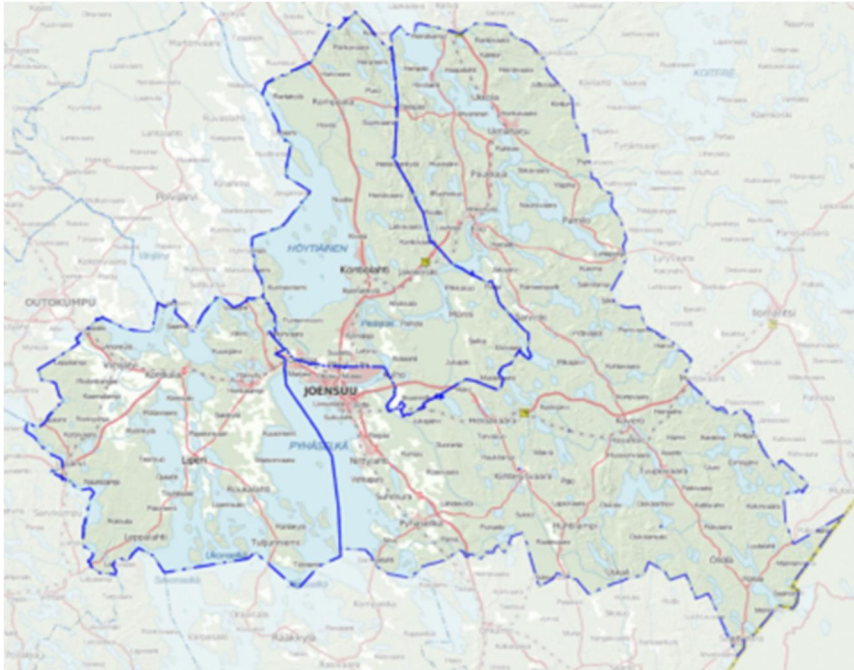
Kuva 1: Joensuun toimivaltainen viranomainen

Joensuun kaupungin toimivalta-alue käsitti vuonna 2022 Joensuun kaupungin sekä Kontiolahden ja Liperin kunnan alueet. Toimivaltaisena viranomaisena toimivalta-alueen rajat ylittävässä liikenteessä toimi Pohjois-Savon elinkeino-, liikenne- ja ympäristökeskus (Liikenne ja infrastruktuuri).