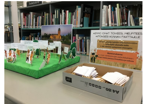
Osallistava mielenilmaus Joensuun pääkirjastolla kesällä 2023

Demokratia Vaarassa -hankkeen hankeajaa jatkettiin vuoteen 2024.