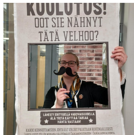
Harry Potter -tapahtuma Ylämyllyllä