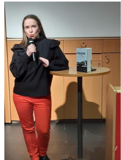
Satu Rämö kirjaston vieraana Carelicumissa helmikuussa