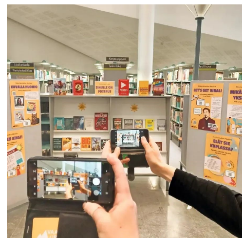
Sinulle on postaus: interaktiivinen näyttely

Lisäksi hankkeessa pilotoitiin faktantarkistuksen sekä verkkokeskustelun työpajoja, mutta heikon toistettavuutensa vuoksi ne eivät päätyneet yhteisiksi materiaaleiksi. Hankkeessa tuotettiin Sinulle on postaus -niminen interaktiivinen näyttely, joka on suunniteltu toimivaksi myös esimerkiksi omatoimijalla.