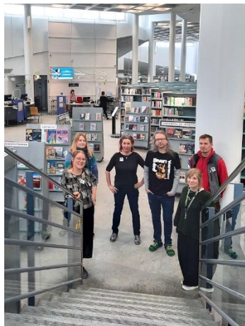
Henkilökunta valmiina viimeiseen viikonloppuun neljän palvelupisteen mallilla

Pääkirjasto oli kiinni remontin takia 18.4.–5.5. Avaamispäivänä tiistaina 6.5. pääkirjastolla oli 6040 kävijää eli kolminkertainen määrä asiakkaita normaaliin tiistaipäivään verrattuna.