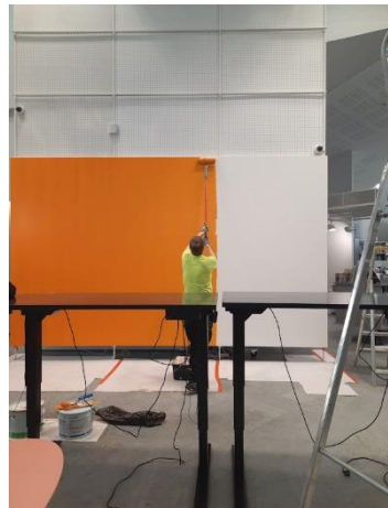
Remontissa pääkirjaston ilmeeseen tuli lisää väriä.