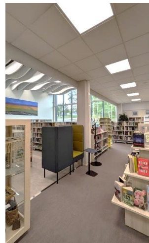
Hammaslahden uusi kirjasto avattiin elokuussa.