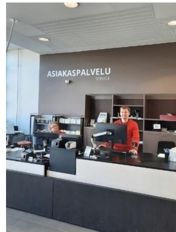
Muutostöiden jälkeen kirjaston asiakaspalvelu keskittyy pohjakerrokseen.