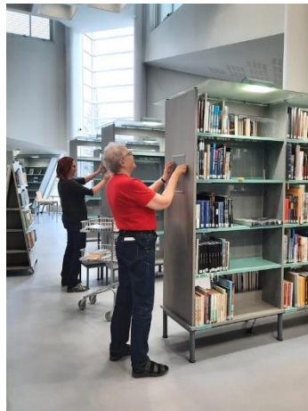
Remontin yhteydessä myös pääkirjaston opasteista tehtiin selkeämpiä.