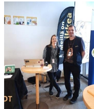
UEF:n uusien opiskelijoiden infomarkkinoilla syyskuussa