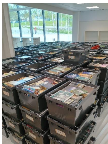
Pakattu aineisto saapuu uuteen kirjastoon.