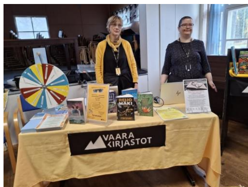
Siun Soten Hei ikäihminen, mitä siulle kuuluu -tapahtumassa lokakuussa