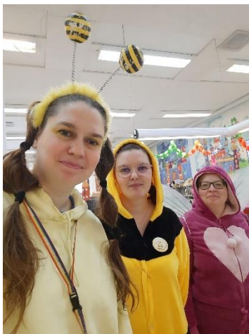
Lehmon kirjaston pörräis-tapahtuma toukokuussa

Pääkirjasto osallistui ensimmäistä kertaa KAVI:n lyhytelokuvapäivään. Koululaisten lomaviikoilla syksyllä ja keväällä pääkirjaston lasten ja nuorten osastolla oli toimintaa koko viikon ajan. Suositut perheaamat jatkoivat myös toimintaansa kerran kuussa.