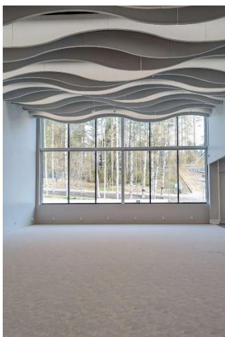
Hammaslahden uusi kirjastosali tyhjänä

Vanha Pyhäselän kirjasto suljettiin kesäkuussa ja Hammaslahden kirjasto avattiin uusissa tiloissa 1. elokuuta. Viikkoa myöhemmin otettiin jälleen käyttöön myös omatoimikirjasto, johon saatiin myös uusi PIN-koodillinen ovenavauslaite. Kirjastoon saatiin myös uutuutena asiakaskäyttöön varattavia tiloja, jotka vietiin myös Joensuun kaupungin tilavarausohjelma Tilavaan.