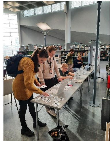
AKE-päivän pakopelipiste Joensuun pääkirjastolla marraskuussa 2025