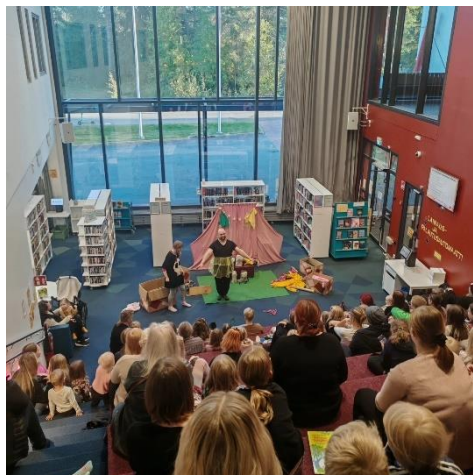
Vaara-kollektiivin Prinsessa Pikkiiriikki -esitys Nepeän kirjastossa syyskuussa