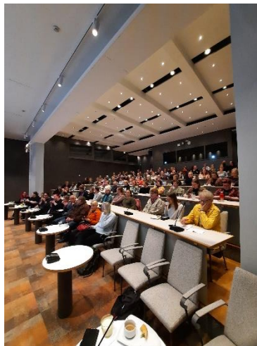
Vaara-kirjastojen henkilökuntaa AKE-päivässä Joensuun tiedepuistolla toukokuussa