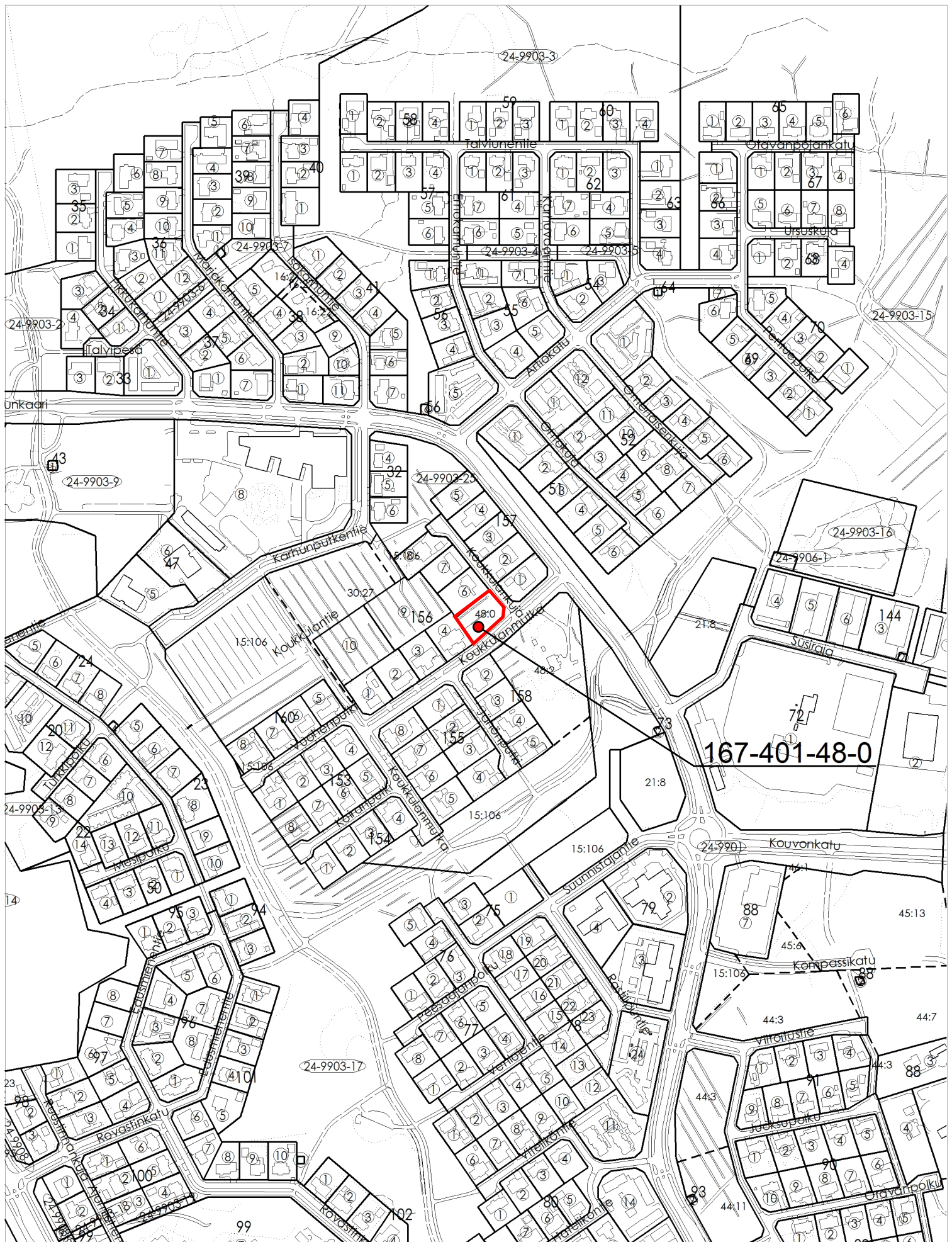
Ote poikkeamispäätökset ja suunnittelutarveratkaisut kartasta 1.1.2020 alkaen