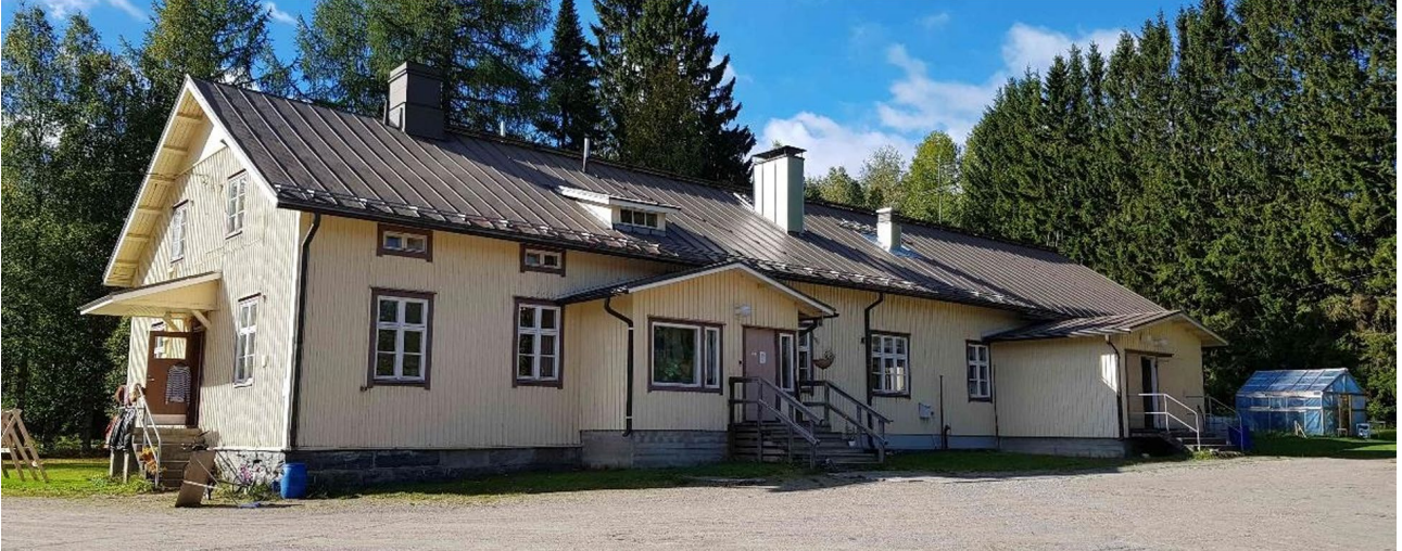
Kuva: A3, Ahmovaaran koulu

Rakennushistoriallisesti arvokas rakennus on kerroksellinen kokonaisuus, jossa on vuoden 1919 jugendin ja vuoden 1949 jälleenrakennuskauden tyyli- ja piirteitä. Monimuotoinen rakennus on mielenkiintoinen ja mieleen jäävä. Sillä on myös identiteetti-arvoa. Rakennuksella on vanhana kaupparakennuksena historiallista arvoa. Keskeisellä paikalla sijaitseva, ympäristöstään maamerkinä erottuva rakennus on maisemallisesti ja kyläkuvallisesti arvokas. Paikallisesti arvokas: R, H, M