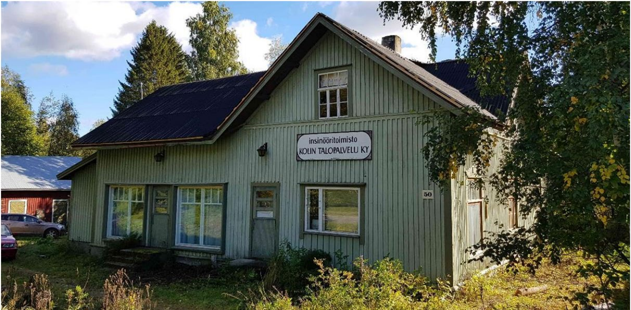
Kuva: A2, Ent. Tanskasen kauppa