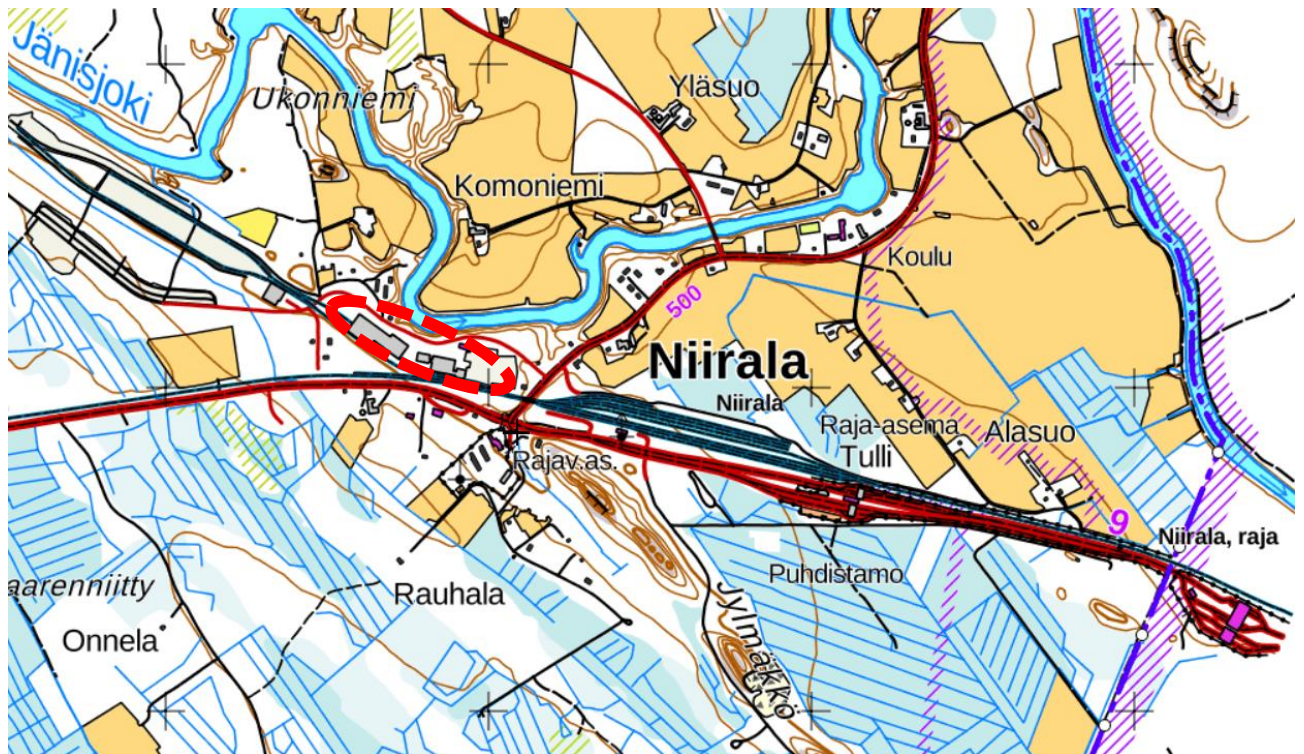
Kuva 1. Suunnittelualueen sijainti (punainen katkoviiva)

Tohmajärvelle Niiralaan on tarkoitus laatia asemakaavan muutos kortteliin 22. Suunnittelualueen pinta-ala on noin 5,63 ha. Kaavatyö koskee kiinteistöä 848-424-4-118. Suunnittelualueen sijainti ja likimääräinen rajaus on esitetty seuraavissa kuvissa.