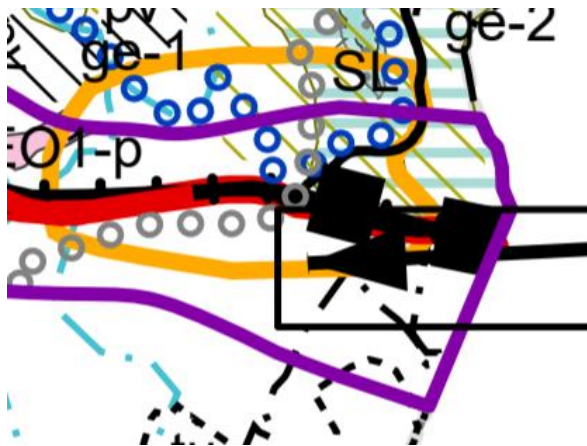
Kuva 4. Ote Pohjois-Karjalan maakuntakaava 2040 ehdotuksesta.

Pohjois-Karjalan kokonismaakuntakaavan tarkistus, maakuntakaava 2040, on ollut ehdotuksena nähtävillä 23.3.–24.4.2020. Koko Pohjois-Karjalan kattava kokonismaakuntakaava kumoaa voimassa olevat 1.–4. vaihemaakuntakaavat lukuun ottamatta tuulivoimaloiden alueita. Maakuntakaavaehdotuksessa suunnittelualue sijoittuu liikenteen kehittämiskäytävän (lk) alueelle sekä kaupan ja rajaliikenteen kehittämisen kohdealueelle (kr-km).