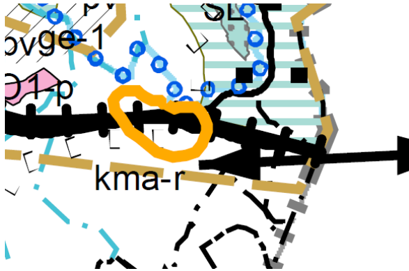
Kuva 3. Ote Pohjois-Karjalan maakuntakaavayhdistelmästä.

Pohjois-Karjalan kokonismaakuntakaavan tarkistus, maakuntakaava 2040, on ollut ehdotuksena nähtävillä 23.3.–24.4.2020. Koko Pohjois-Karjalan kattava kokonismaakuntakaava kumoaa voimassa olevat 1.–4. vaihemaakuntakaavat lukuun ottamatta tuulivoimaloiden alueita. Maakuntakaavaehdotuksessa suunnittelualue sijoittuu liikenteen kehittämiskäytävän (lk) alueelle sekä kaupan ja rajaliikenteen kehittämisen kohdealueelle (kr-km).