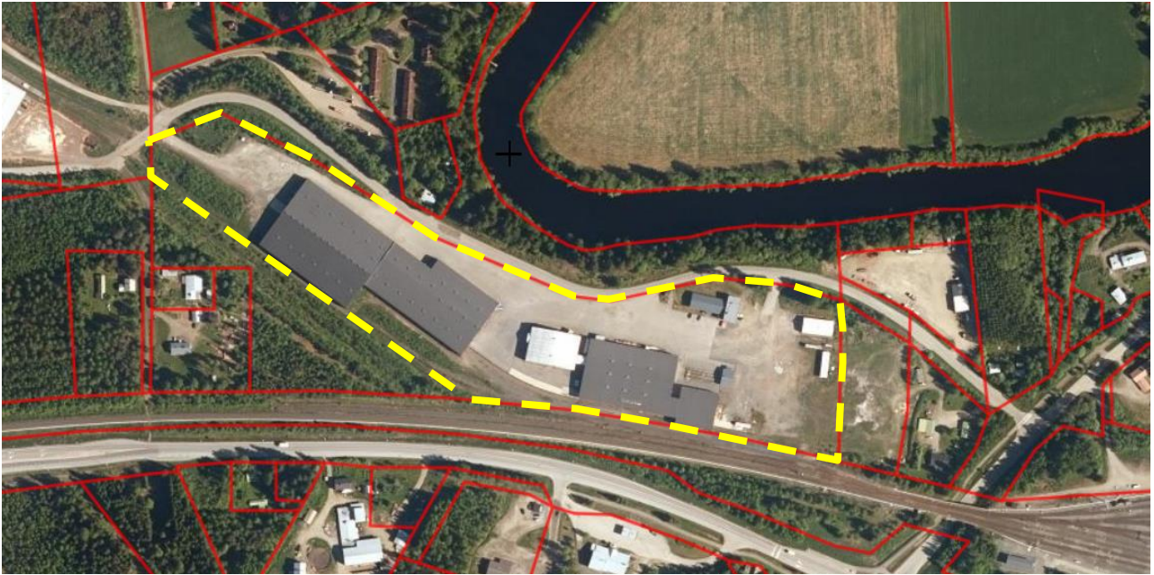
Kuva 2. Ortoilmakuva alueesta. Suunnittelualueen likimääräinen rajausta keltaisella ja kiinteistörajat punaisella.