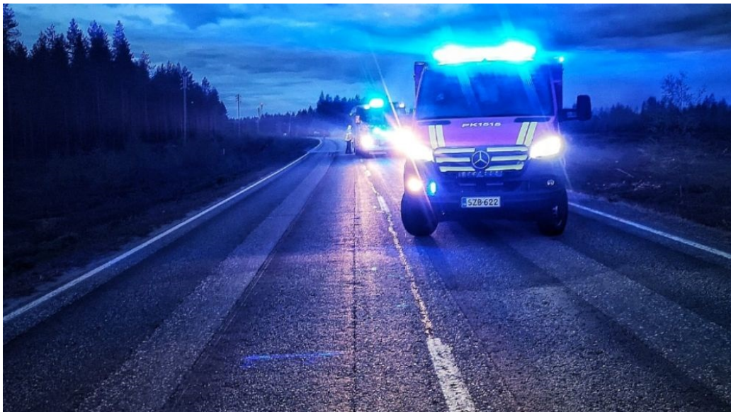
Kuva 7: Pelastajat tiellä. Liikenneonnettomuudet ovat keskeinen onnettomuustyyppi. Maakunnan teillä tapahtuu onnettomuuksia vuosittain n. 450 kappaletta. Onnettomuuspaikat ovat vaarallisia myös pelastushenkilöstölle. Älä kuvaa tai hurjastele!

Sortumaonnettomuuksien kalustolliset ja yhteistoiminnalliset valmiudet (tp. D5).