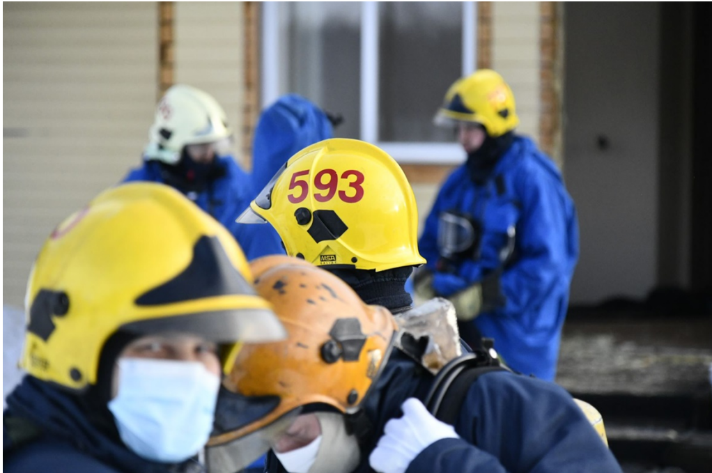
Kuva 2: Henkilöstöä savusukellusharjoituksessa. Harjoitustoiminnalla varmistetaan henkilöstön osaaminen ja valmius.