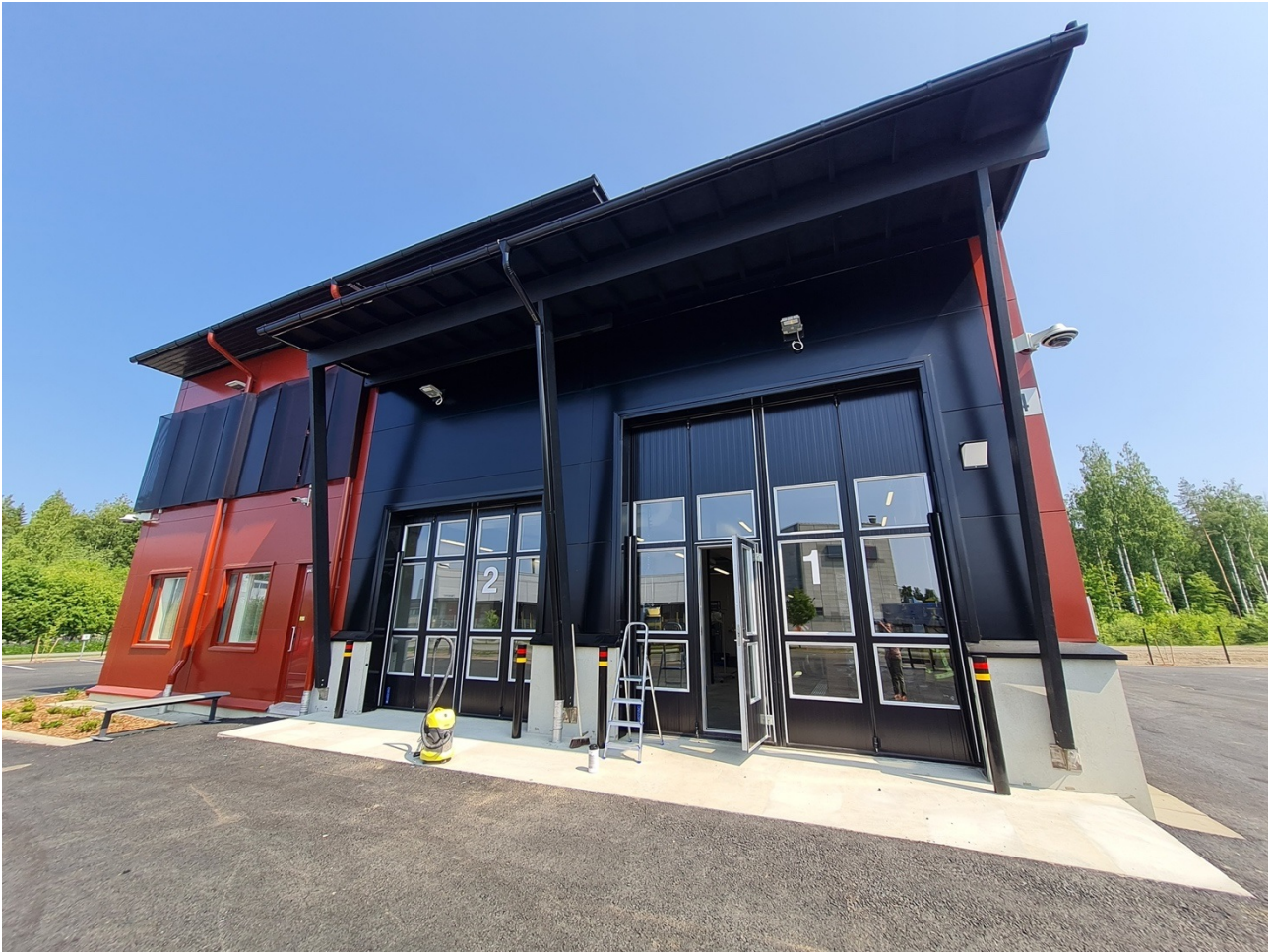
Kuva 6 :Joensuun Pekkalaan valmistui uusi pelastusasema vuonna 2022. Pelastusasemalle on sijoitettu kevyt pelastusyksikkö ja ensihoitoyksikkö.