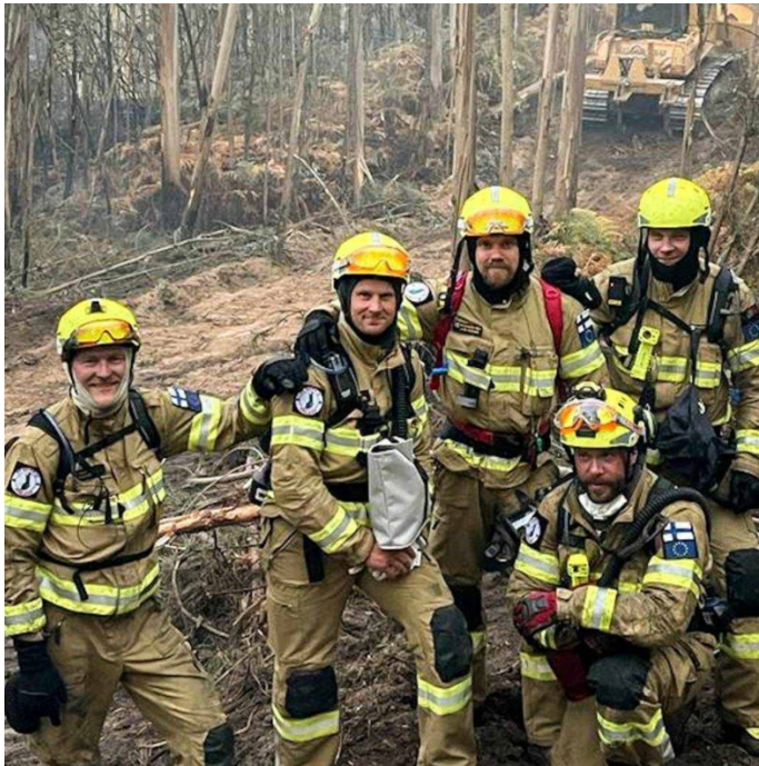
Kuva 8: Pelastuslaitoksen henkilöstöä kansainvälisellä tehtävällä. Pelastuslaitos osallistuu Euroopan pelastuspalvelumekanismiin toimintaan yhdessä naapuripelastuslaitosten kanssa.