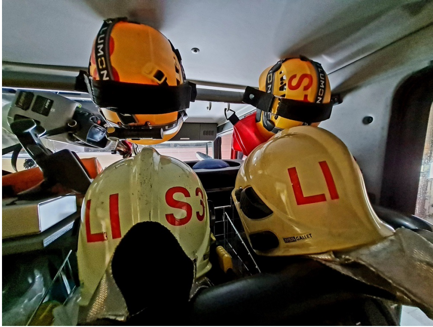
Kuva 3: Kalustoa sammutusautossa. Kalusto edellyttää jatkuvaa kehittämistä ja ylläpitoa. Tiukassa taloudellisessa tilanteessa painopiste on henkilöstön suojavarusteissa.