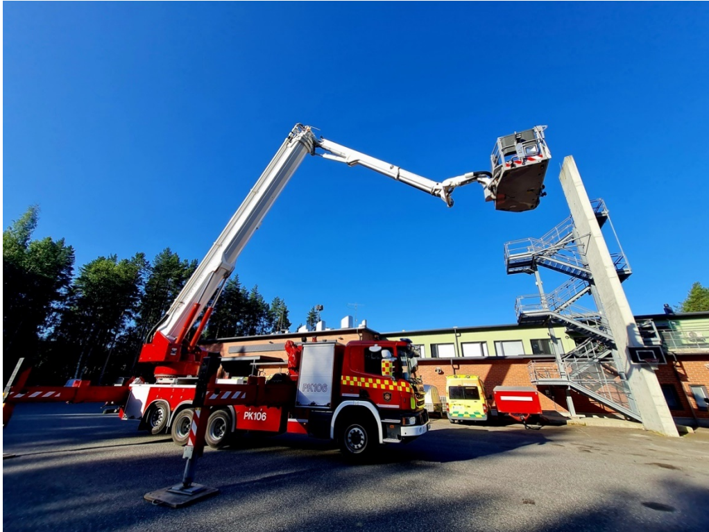
Kuva 5: Nostolava 106 harjoituksessa. Pelastuslaitos ylläpitää tarpeellista määrää erikoiskalustoa, joka vastaa alueella olevaan onnettomuusuhkaan. Nostolavalla varaudutaan pelastamaan ihmisiä korkealta ja sammuttamaan kattorakenteiden tulipaloja.

Kehittämistarpeet on kuvattu pelastuslaitoksen investointiohjelmassa.