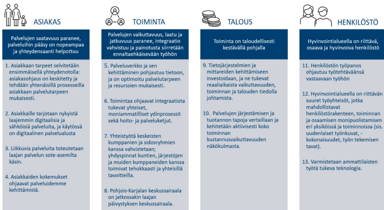
Kuva 2. Palvelustrategian neljä keskeistä päämäärää ja 13 tavoitetta päämääriin pääsemiseksi

Aluevaltuusto päätti kesäkuussa 2023 sosiaali- ja terveydenhuollon palvelustrategiasta ja -verkkosuunnitelmasta. Päätöksestä tehdyn aluevalituksen seurauksena Itä-Suomen hallinto-oikeus kumosi valtuuston päätöksen asian valmistelussa todettujen esteellisyyksien vuoksi. Pohjois-Karjalan hyvinvointialueen palvelustrategia ja -verkkosuunnitelma valmisteltiin ja hyväksyttiin uudelleen aluevaltuustossa 9.10.2024. Palvelustrategia- ja verkkosuunnitelma toimeenpannaan alueellisten sote-palvelujen järjestämissuunnitelmien avulla. Tavoitteena on, että aluehallitus päättää alueellisista järjestämissuunnitelmista joulukuussa 2024, jolloin strategian mukaiset uudet toimintamallit voidaan ottaa käyttöön aikaisintaan vuoden 2025 alussa.