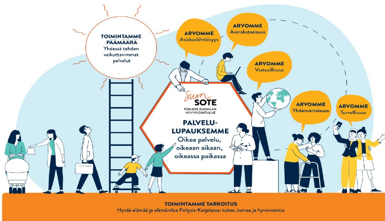
Kuva 1. Pohjois-Karjalan hyvinvointialueen strategia

Aluevaltuusto hyväksyi syyskuussa 2022 Pohjois-Karjalan hyvinvointialuestrategian vuosille 2023–2026. Toimintamme päämääränä Strategian keskeinen sisältö, arvot, visio ja missio on tiivistetty kuvaan 1. Toimintamme päämäärä on ”Yhdessä tehden vaikuttavimmat palvelut”. Arvomme ovat asiakaslähtöisyys, avarakatseisuus, vastuullisuus, yhdenvertaisuus ja turvallisuus. Palvelulupauksemme on ”Oikea palvelu, oikeaan aikaan, oikeassa paikassa”.