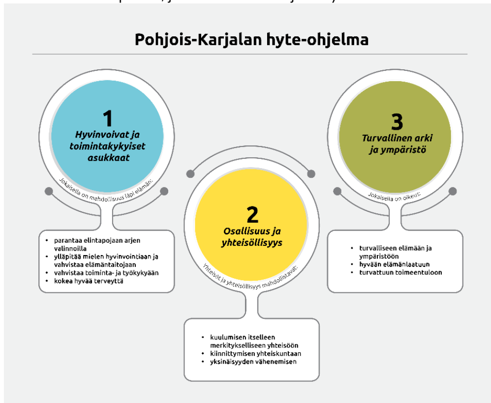
Kuva 2. Pohjois-Karjalan hyte-ohjelma, painopisteet sekä tavoitteet.

Jokaisen painopisteen kehittymisen seurantaan on määritelty indikaattorit, jotka maakunnallisen hyte-ohjelman osalta ovat THL:n vähimmäistietosisällön Hyvinvoinnin tila -osion asetusluonnoksen mukaiset indikaattorit ja hyte-kertoimet. Maakunnallinen hyvinvointikertomus nostaa kärkiteemoiksi kotoutumisen, kulttuurihyvinvoinnin, työllisyyden, turvallisuuden sekä hyte-työn kumppanuuden ja ilmaston vaikutuksen turvallisuuteen ja asuin ympäristöön. Ilomantsin kunnan eri toimialat määrittävät hyvinvointikertomukseen yksikkökohtaisia hyvinvoinnin ja terveyden edistämisen toimenpiteitä, jotka keskusteltiin johtoryhmässä.