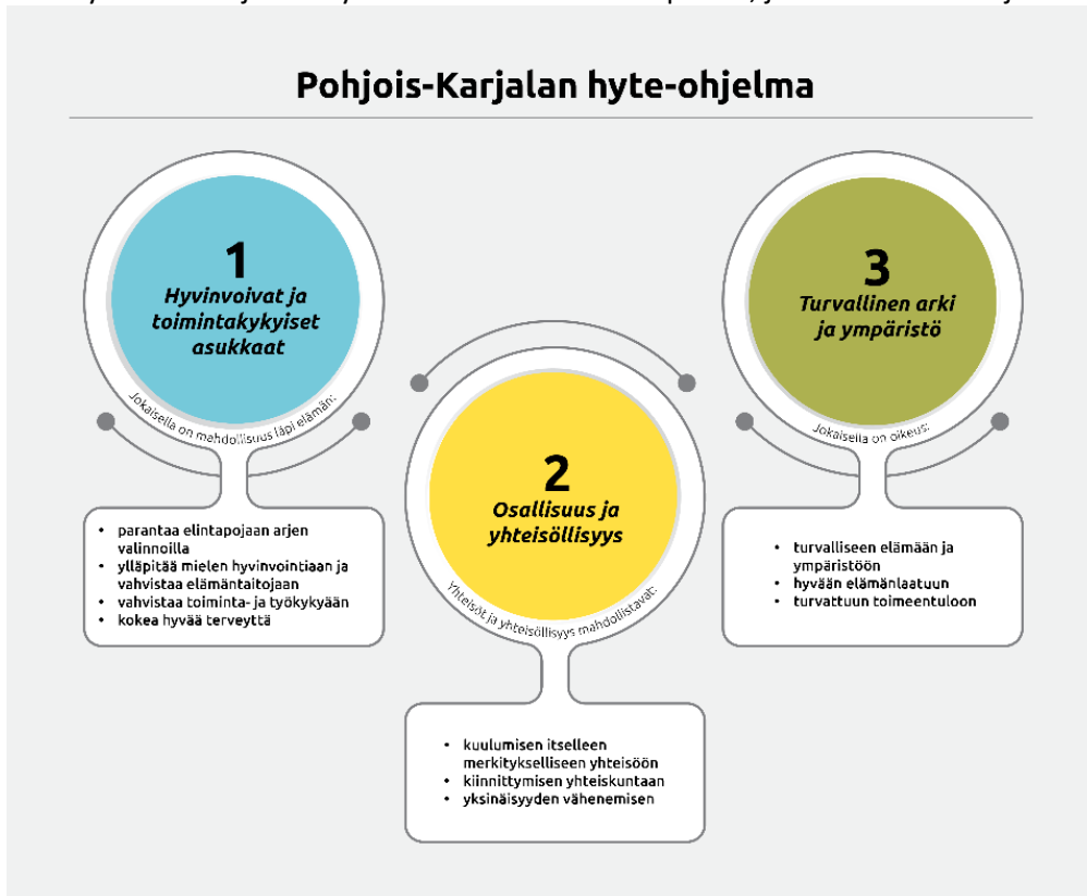
Kuva 2. Pohjois-Karjalan hyte-ohjelma, painopisteet sekä tavoitteet.

turvallisuuteen ja asuin ympäristöön. Ilomantsin kunnan eri toimialat määrittivät hyvinvointikertomukseen yksikkökohtaisia hyvinvoinnin ja terveyden edistämisen toimenpiteitä, jotka keskusteltiin johtoryhmässä.