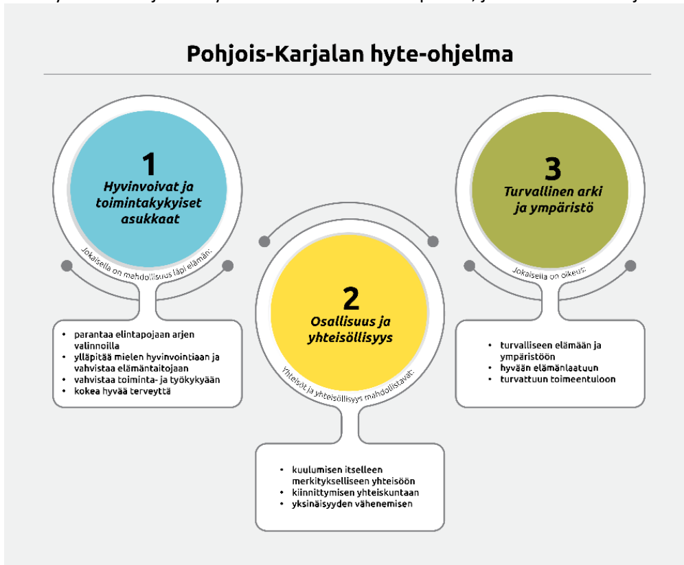
Kuva 2. Pohjois-Karjalan hyte-ohjelma, painopisteet sekä tavoitteet.

turvallisuuteen ja asuin ympäristöön. Ilomantsin kunnan eri toimialat määrittävät hyvinvointikertomukseen yksikkökohtaisia hyvinvoinnin ja terveyden edistämisen toimenpiteitä, jotka keskusteltiin johtoryhmässä.