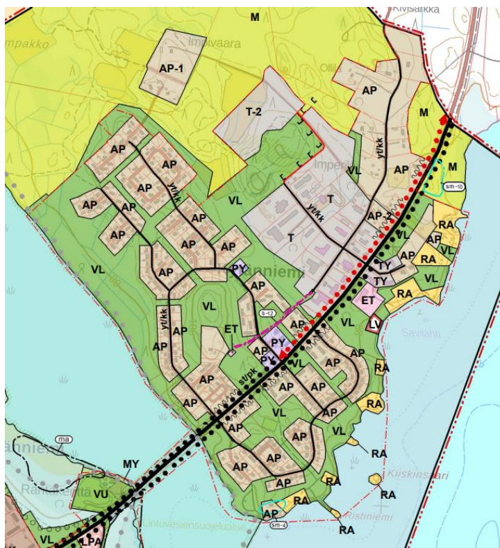
Kuva 3. Ote Kiteen keskustan osayleiskaavasta.