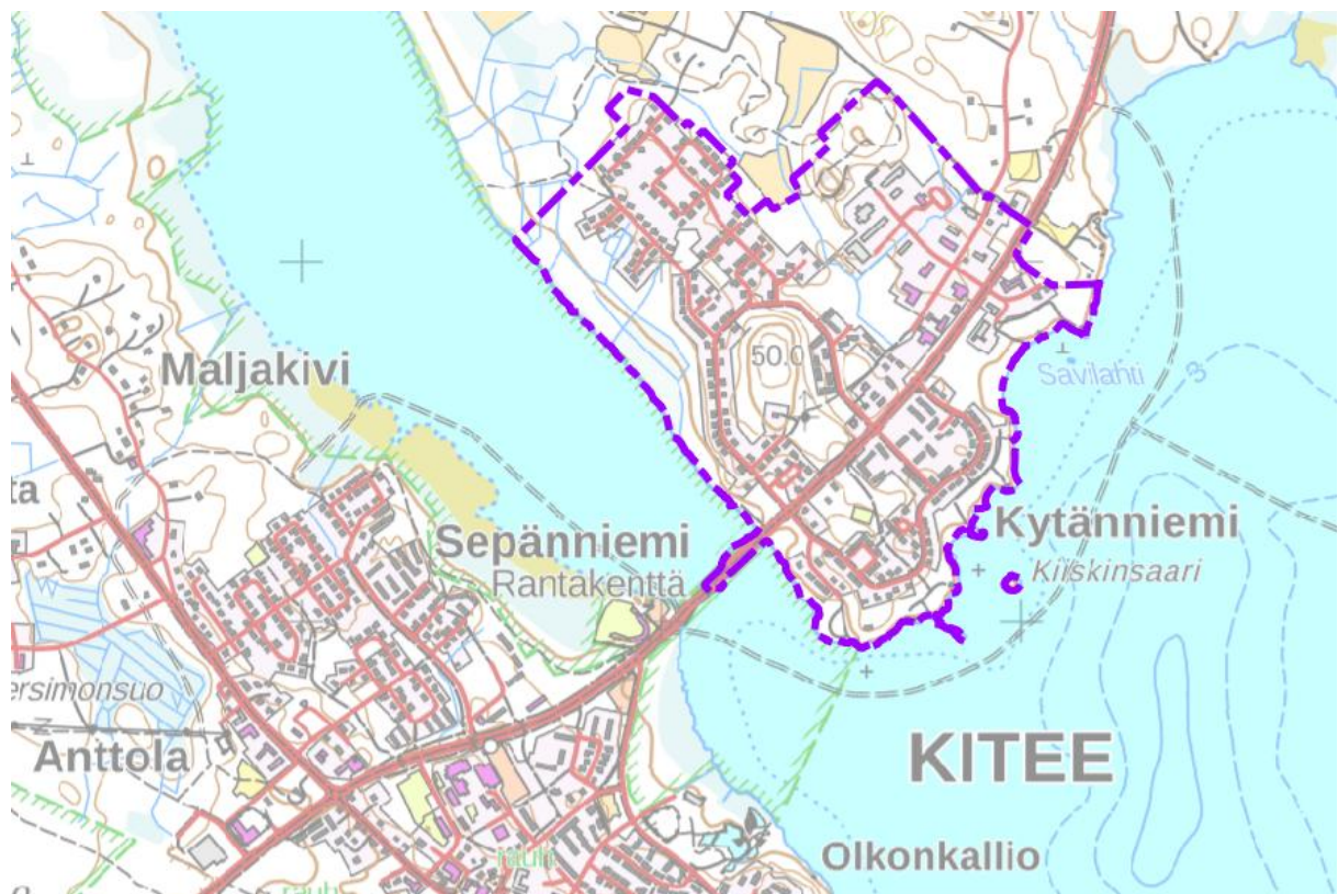
Kuva 1. Suunnittelualueen sijainti ja likimääräinen raja- raus violetilla.

Kiteen keskustan asemakaavat on tarkoitus päivittää kokonaisuudessaan. Työ tehdään kolmessa osassa, joista ensimmäisenä päivitettävä osa-alue 1 sijoittuu Kytänniemen alueelle keskustan pohjoisosaan. Suunnittelualueen pinta-ala on noin 133 ha. Suunnittelualueen sijainti ja likimääräinen raja- raus ilmenevät seuraavasta kuvasta.