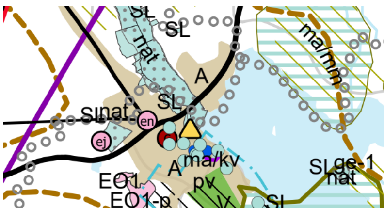
Kuva 2. Ote Pohjois-Karjalan maakuntakaavayhdistelmästä.

Alueella on voimassa Pohjois-Karjalan maakuntakaava 2040 ja Pohjois-Karjalan maakuntakaava 2040, 1. vaihe. Voimassa olevassa maakuntakaavayhdistelmässä suunnittelualueeseen kohdistuvat seuraavat merkinnät: taajamatoimintojen kehittämisvyöhyke, taajamatoimintojen alue ja seututie.