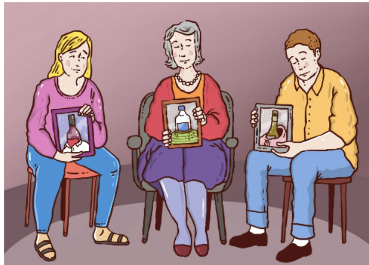
Alkoholistien läheisten vertaisryhmissä moni voi kokea ensimmäistä kertaa, ettei ole yksin kokemustensa kanssa.

"Häpeä hälveni, kun ymmärsin, että alkoholisti on sairas" – Läheisten vertaisryhmässä moni kokee ensimmäistä kertaa aitoa tukea ja ymmärrystä – ja löytää toivon