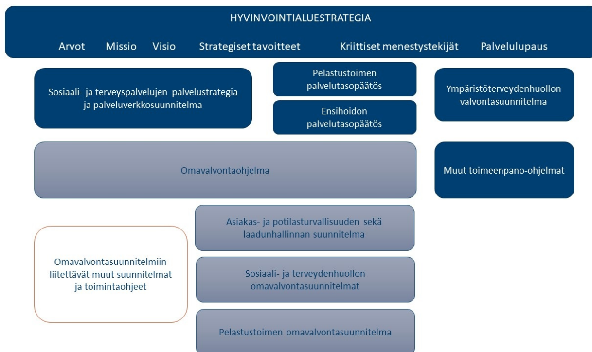
KUVIO 3. OMAVALVONTAOHJELMAN SIOITTUMINEN Pohjois- Karjalan Hyvinvointialuestrategiakokonaisuuteen