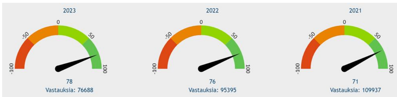
Kuva 5. Hyvinvointialueen NPS-mittarin lukemat.

Kuvat 5 ja 6 osoittavat suositteluhalukkuutta. NPS-luku toimii Pohjois-Karjalan hyvinvointialueella asiakastyytyväisyyden strategisena mittarina. NPS-mittari kertoo reaaliaikaisesti, kuinka suuri osa asiakkaista suosittelee Siun sotea läheisilleen ja tuttavilleen. Mitä suurempi lukema, sitä tyytyväisemmät asiakkaat Siun sotella on. Positiivinen NPS-luku on jo hyvä, ja yli 50 arvoa voidaan pitää erinomaisena.