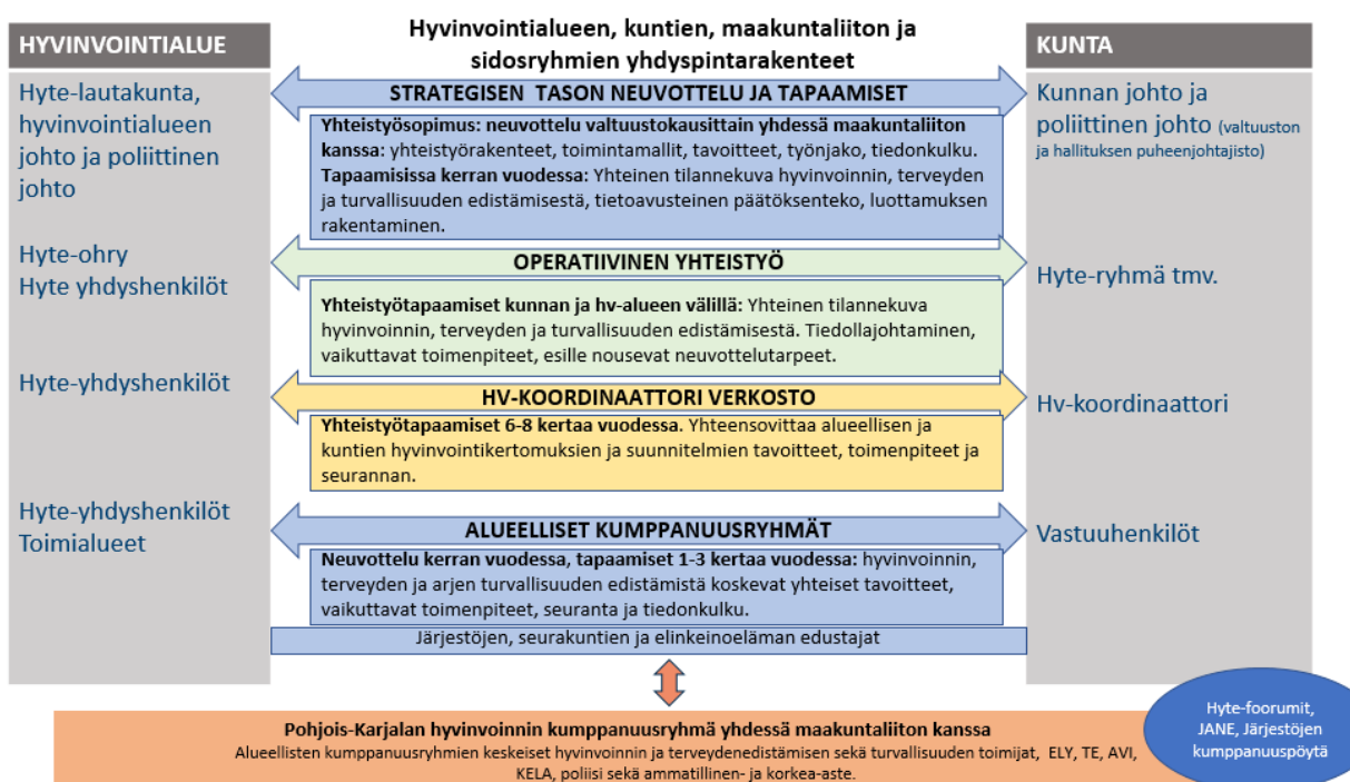
Kuva 2. Pohjois-Karjalan eri toimijoiden yhdyspintarakenne 114 .

Kuntien ja hyvinvointialueen yhteistyötarpeita on muun muassa hyvinvoinnin ja terveyden edistämisessä, sivistys- ja sote-palveluiden yhdyspinoilla, lasten, nuorten ja perheiden palveluissa, vammaisten palveluissa, ikäihmisten palveluissa, kotoutumisessa sekä turvallisuuden ja varautumisen tehtävissä sekä työllisyyden edistämisessä. 115