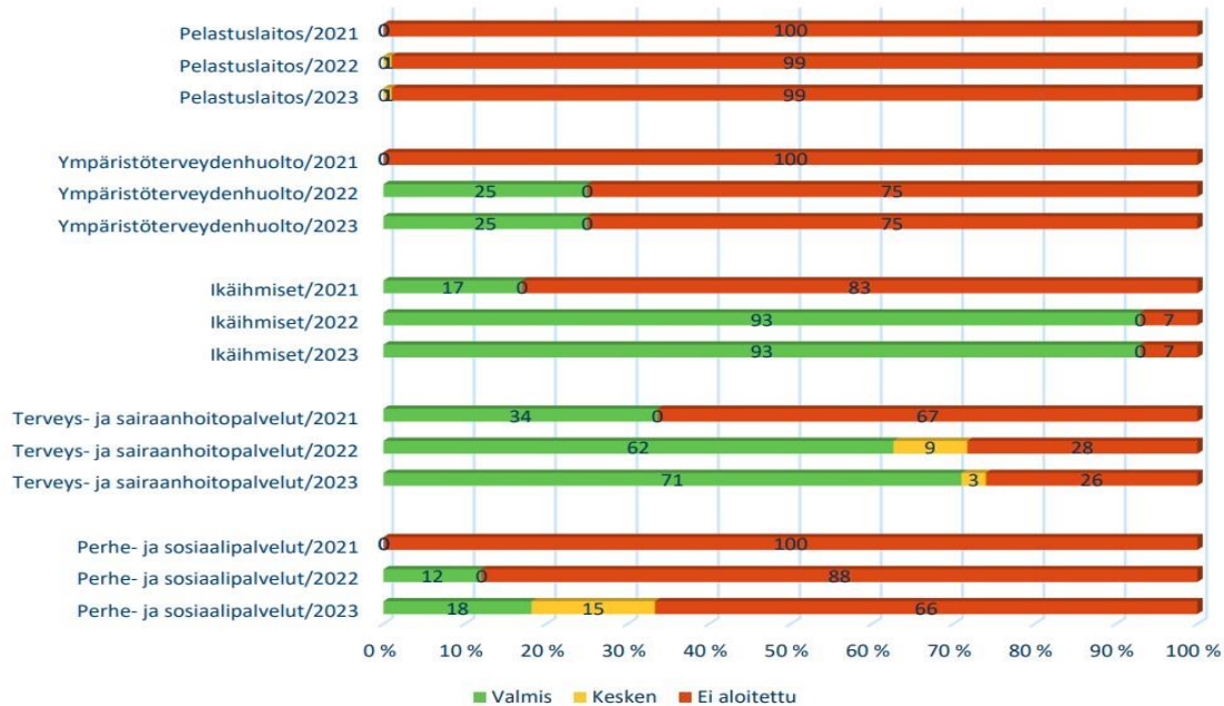
Kuva 3. Asiakaskokemusta mittaavien yksiköiden määrän lisääntyminen.