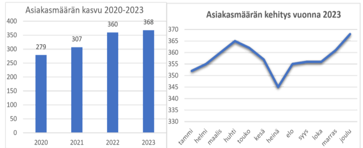
Kuvio 5. Asiakasmäärän kasvu ja kehitys