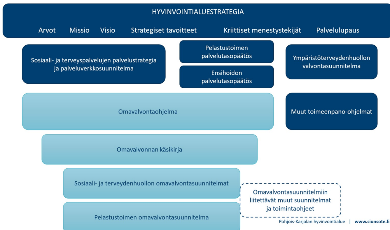
KUVIO 3. OMAVALVONTAHOJELMAN SIOITTUMINEN- POHJOIS- KARJALAN HYVINVOINTIALUESTRATEGIAKOKONAISUUTEEN

Omaevalvonta kytkeytyy tiiviisti Pohjois-Karjalan hyvinvointialueen toimintaan ja tukee osaltaan hyvinvointialuestrategian tavoitteiden saavuttamista varmistamalla asukkaiden perusoikeuksien heille turvaamat, tarpeidensa mukaiset palvelut oikeaan aikaan, yhdenvertaisesti ja saavutettavasti, laadukkaasti ja turvallisesti. Omaevalvontaohjelma myös tukee ja varmentaa muiden toimeenpano-ohjelmien (kuten henkilöstöohjelman ja osallisuusohjelman) toteutumista muun muassa omaevalvonnalla tuotetun seurantatiedon keinoin. Kuviossa 3 kuvataan tämän omaevalvontaohjelman sijoittuminen hyvinvointialuestrategiakokonaisuuteen.