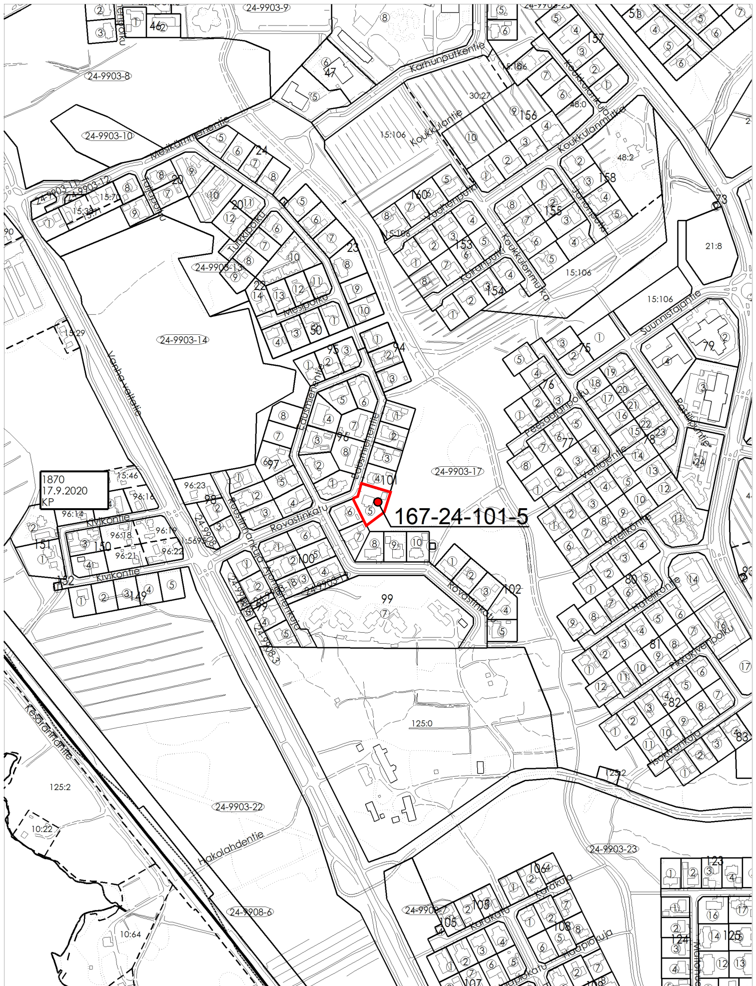
Ote poikkeamispäätökset ja suunnittelutarveratkaisut kartasta 1.1.2020 alkaen