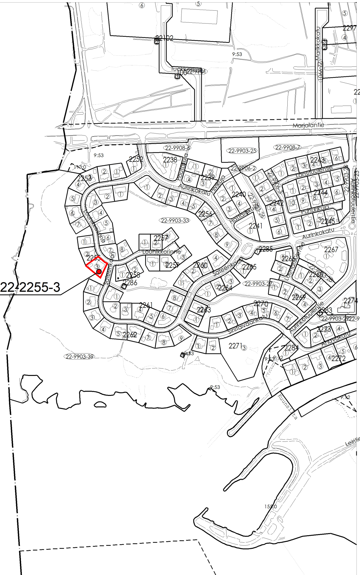
Ote poikkeamispäätökset ja suunnittelutarveratkaisut kartasta 1.1.2020 alkaen