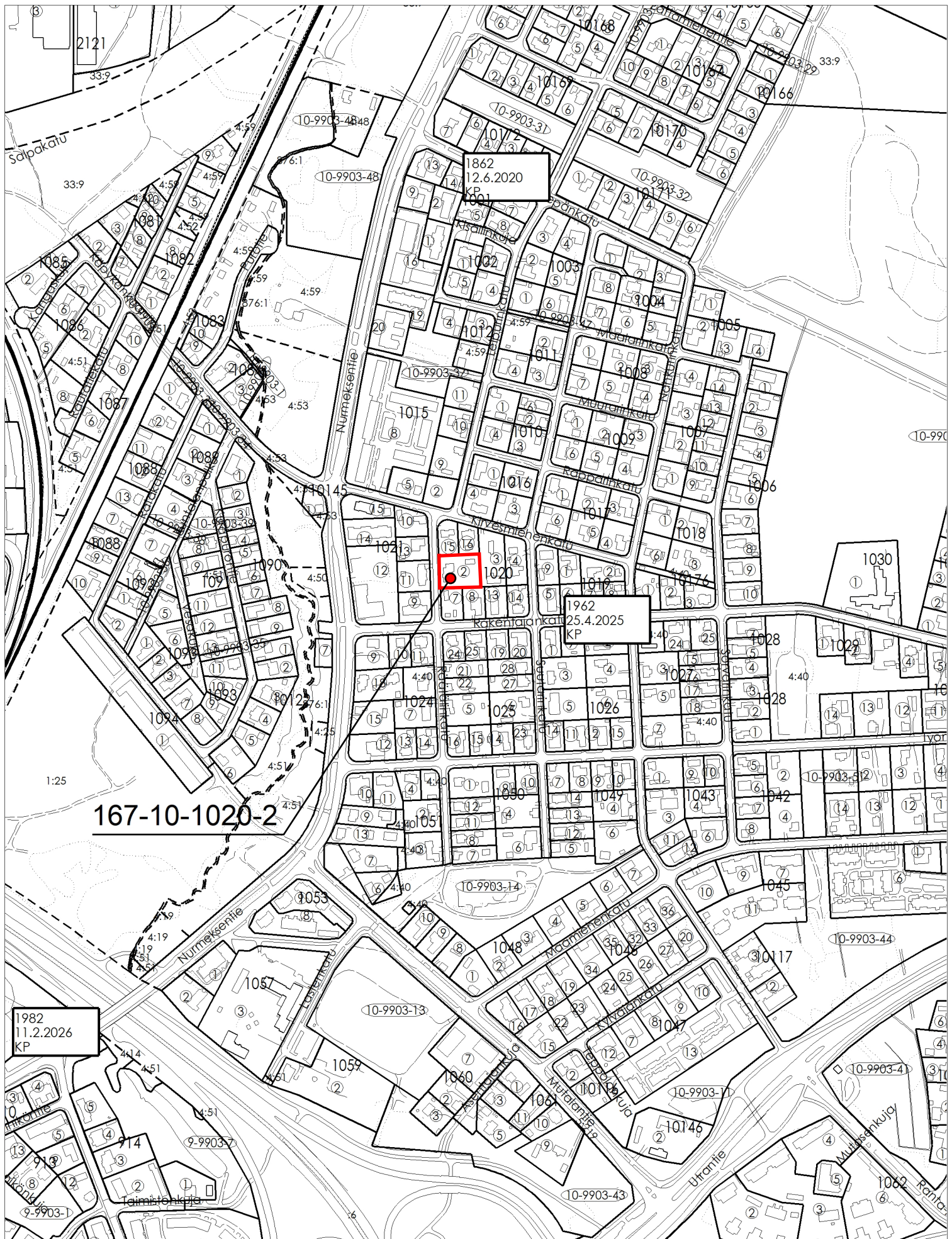
Ote poikkeamispäätökset ja suunnittelutarveratkaisut kartasta 1.1.2020 alkaen