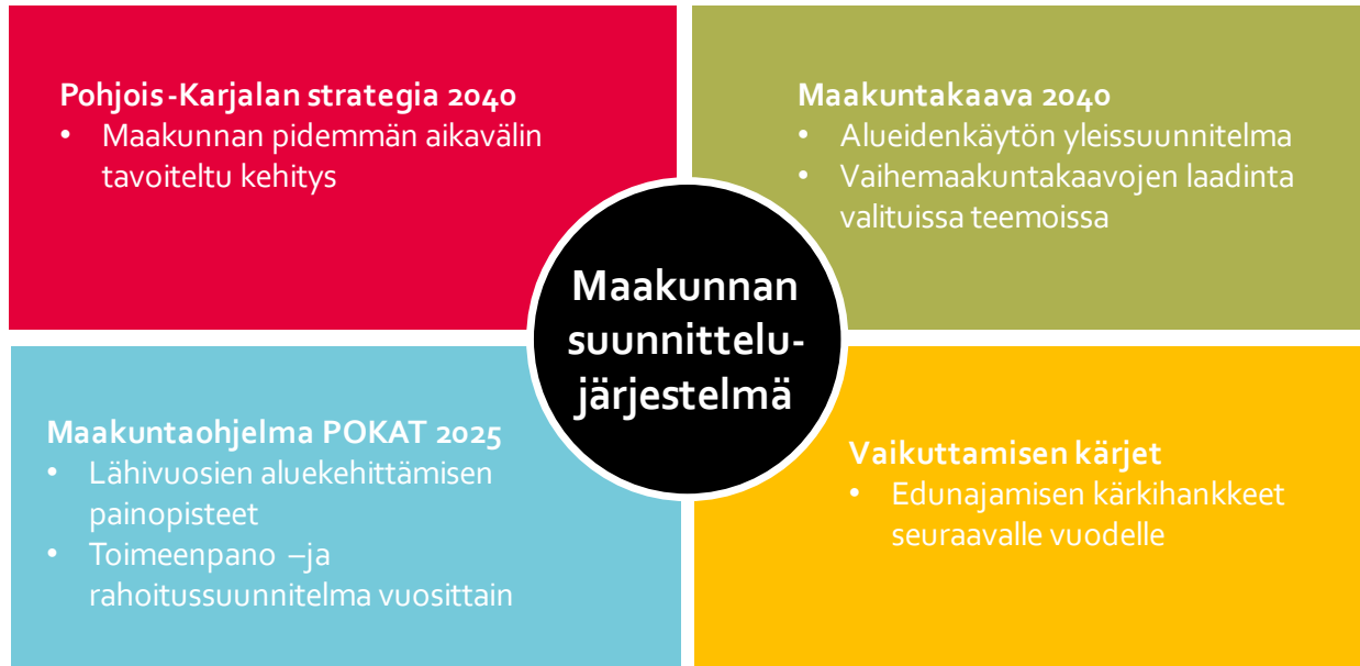
Kuva 3. Maakunnan suunnittelujärjestelmä

Maakuntasuunnitelma, maakuntaohjelma ja maakuntakaava ovat maankäyttö- ja rakennuslain ja alueiden kehittämissä mukaiset keskeiset suunnitelmat, jotka antavat strategisen pohjan maakuntaliiton toiminnalle aluekehitysviranomaisena.