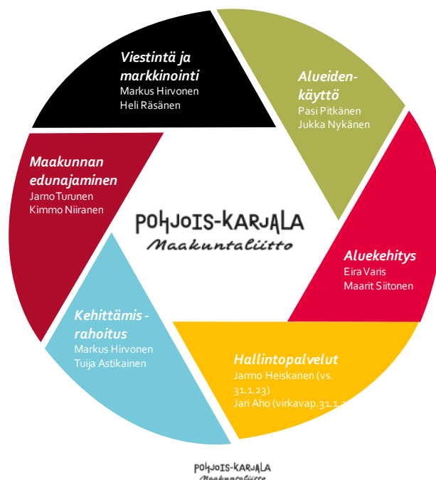
Kuva 1. Pohjois-Karjalan maakuntaliiton organisaatiokaavio

Johtoryhmän muodostavat yksiköiden esihenkilöt ja johtajat sekä viestintäpäällikkö. Johtoryhmän puheenjohtajana toimii maakuntajohtaja, varapuheenjohtajana hänen sijaisensa ja sihteerinä johdon sihteeri. Johtoryhmän kokouksiin voidaan lisäksi kutsua kulloinkin käsiteltävänä olevan asian asiantuntijoita.