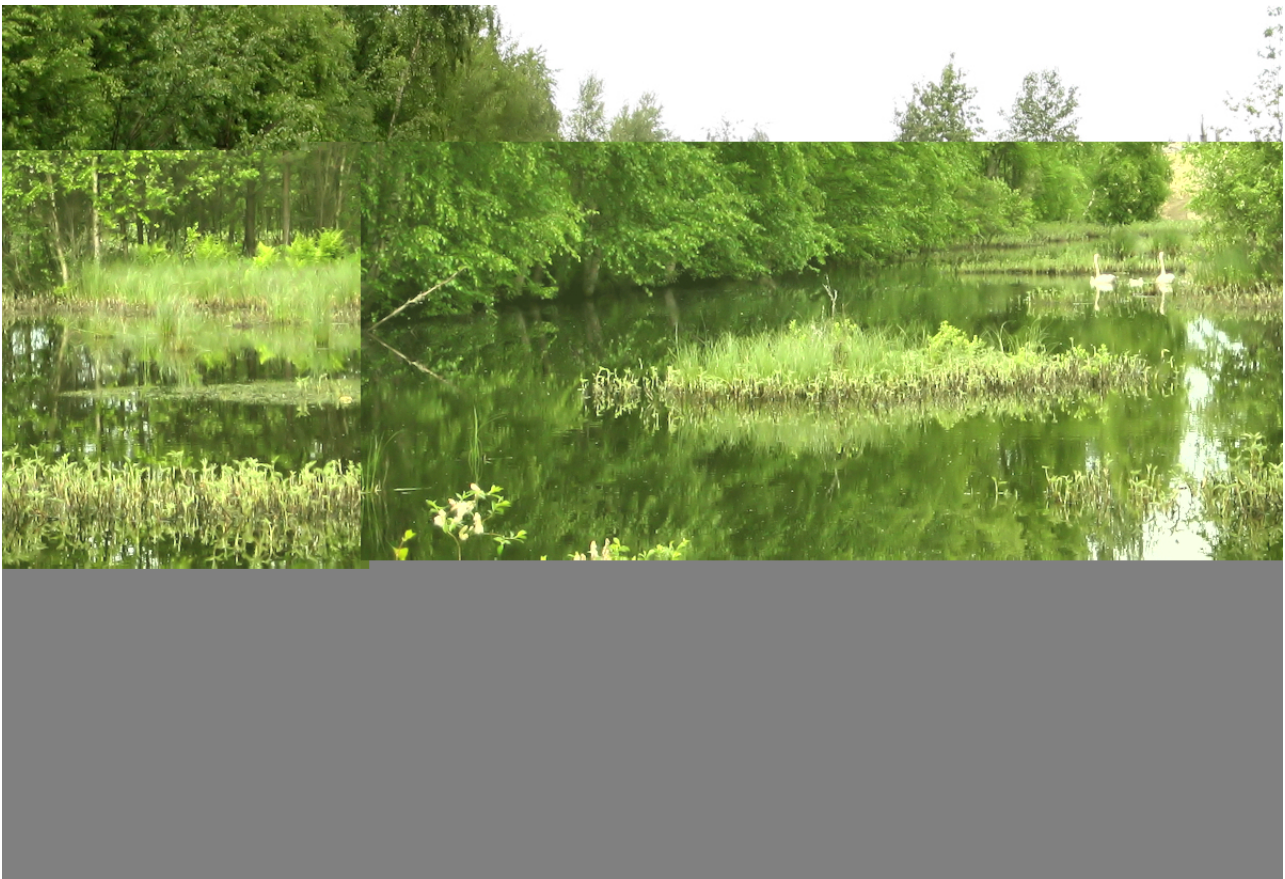
Kuva 3: Laulujoutsenpoikue Lehmonsuon altailla

Lehmonsuon länsipuolella heti kunnanrajan pohjoispuolella sijaitsee joitain pienehköjä vesialtaita, joilla ei muuten liene kovin suurta linnustollista merkitystä mutta altailla pesii kuitenkin yksi laulujoutsenpari ja 2-3 telkkäparia. Laulujoutsenilla oli maastokäynnin aikaan jo 3 pienehköä poikasta mukana.