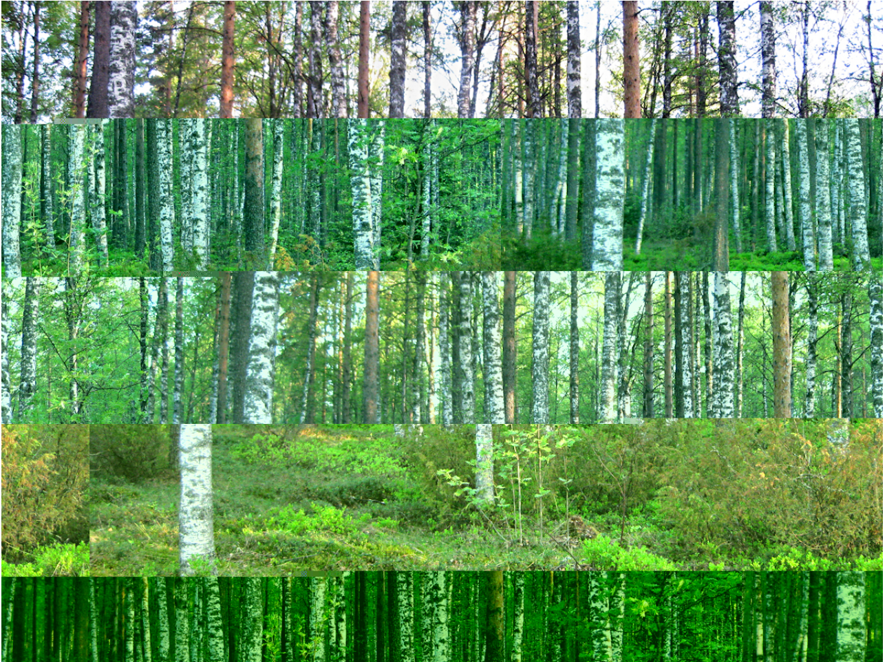
Kuva 2: Harvaa mänty-hieskoivu sekametsää Lehmonsaaren lounaispuolella