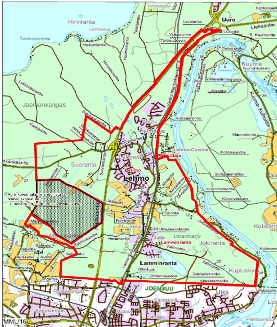
Kuva 1. Lehmon osayleiskaava-alue