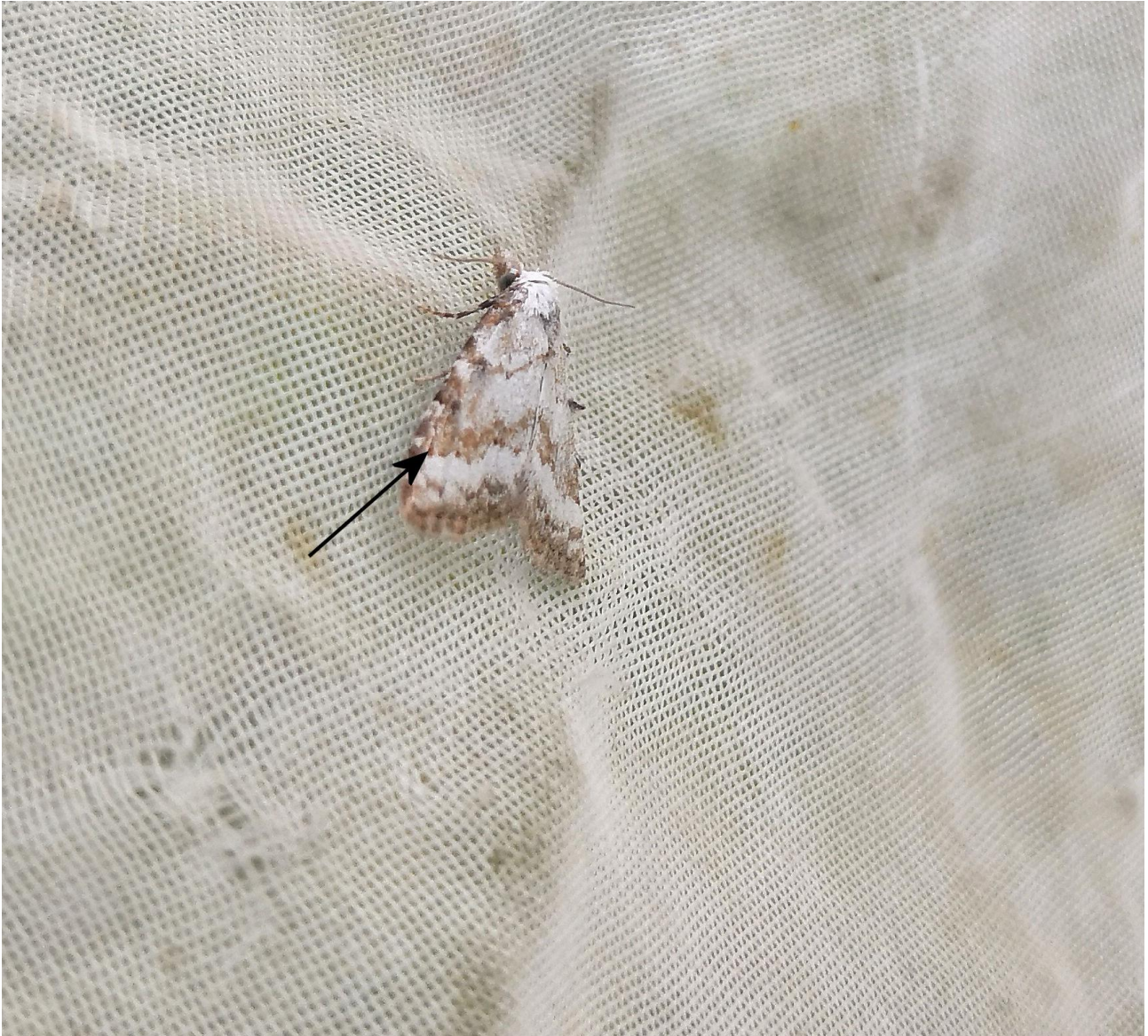
Kuva 5. Ramevenhokas, tuntomerkkinä oleva suora kulma poikkiviirussa on merkitty nuolella.

Lisäksi perhosen lentoaikana soilla on saman kokoisia hyvin yleisiä koisia, lähinnä kulma- ( Chrysoteuchia culmella ) ja metsäheinäkoisia ( Crambus lathoniellus ) sekä lennon loppupuolella kiilajuovakoisia ( Catoptria margaritella ). Näiden erottaminen lentävästä suoventhokkaasta vaatii vähintään pitkän katseen.