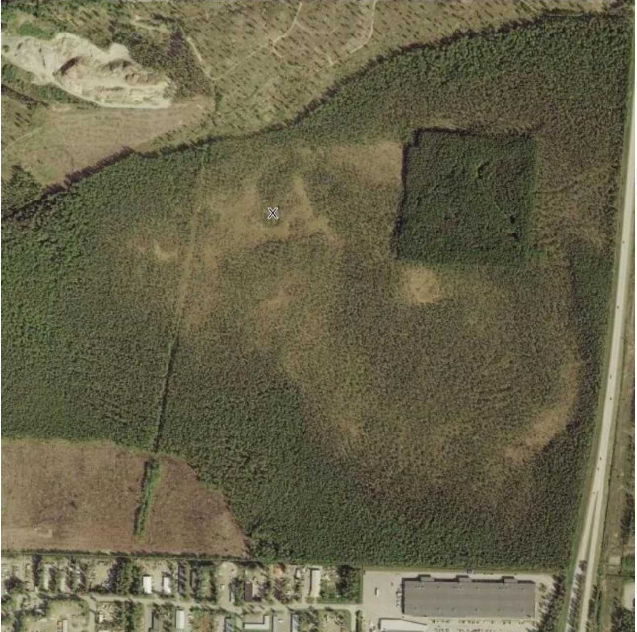
Kuva 7. Riekkopoikueen löytöpaikka.