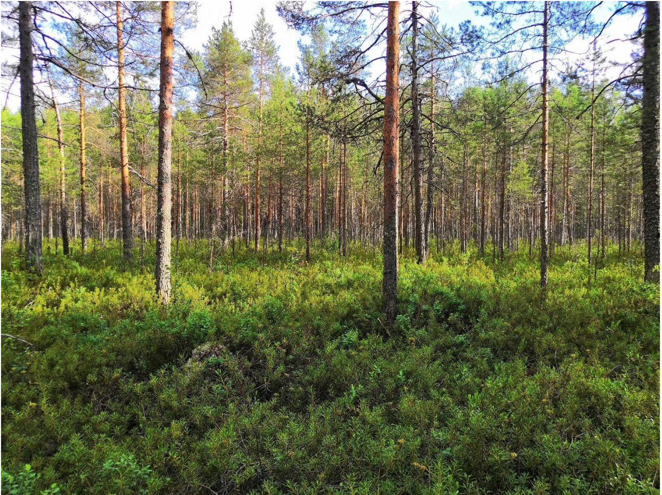
Kuva 2. Raatesuo on suurimmalta osin isovarpuista rämettä.

Raatesuo on isovarpuräme (kuva 2), jossa lähes koko alueella on männikköä, aluskasvillisuutena on suokukkaa, suopursua, juolukkaa, puolukkaa, mustikkaa, vaiveroa ja vaivaiskoivua. Kanervaa on vain vähän.