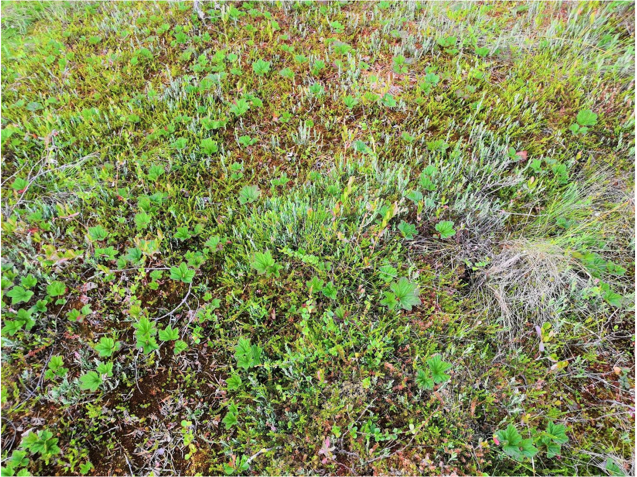
Kuva 4. Suomuurain eli lakka ja suokukka ovat Raatesuolla yleisiä.

Lajin sanotaan lentävän Etelä- ja Keski-Suomessa lähinnä parittomina vuosina. Kuitenkin Liperissä laji oli runsain vuonna 2016. Liperissä lajin aikaisin aloituspäivä on 22.6.2005 ja myöhäisin 12.7.2006, keskiarvon ollessa 3.7. Parasta lentoaikaa on yleensä kesä-heinäkuun vaihe. Myöhäisimmät havainnot ovat 18.7.2018 ja 20.7.2015. Vuosi 2015 oli poikkeuksellisen myöhäinen.