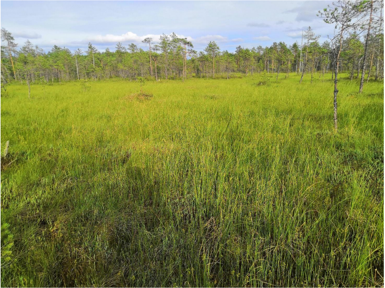
Kuva 3. Avoimimmat kohdat ovat nevamaisia.