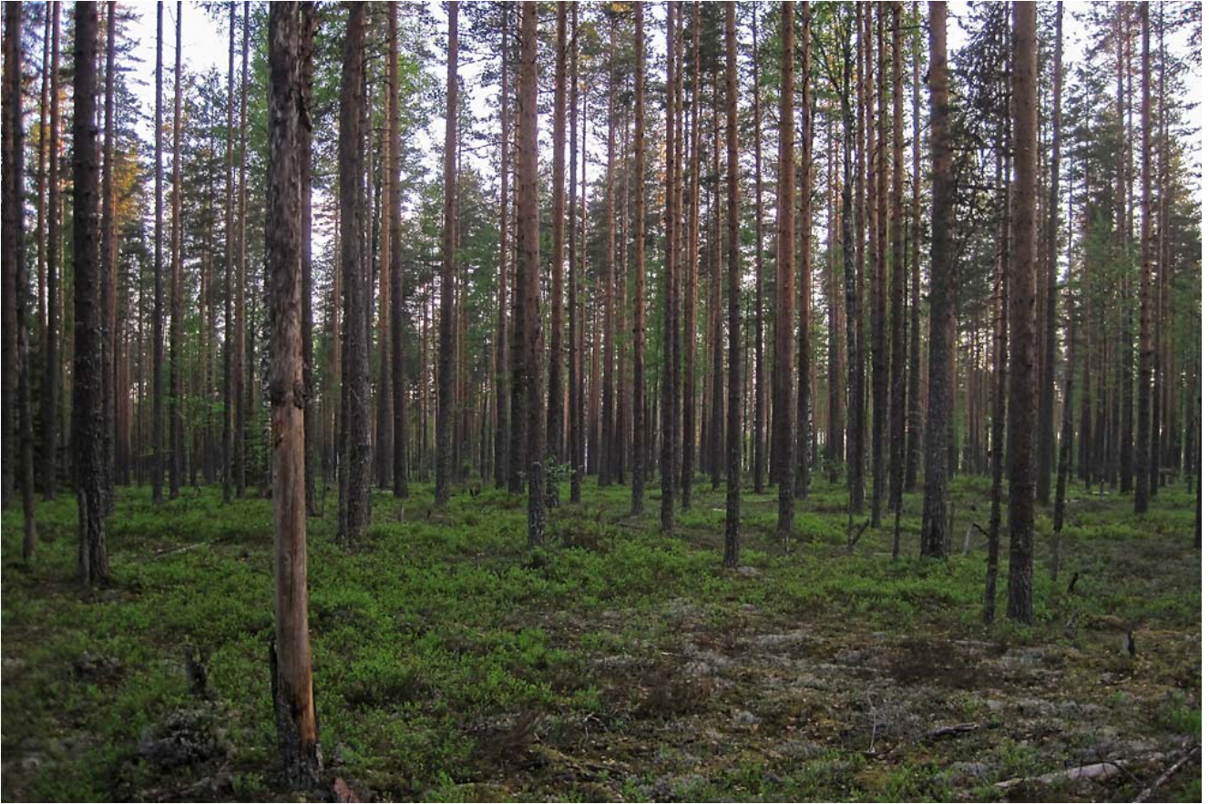
Kuva 3: Ylhäällä suojelullisesti merkittävät lajit kartalla ja alhaalla tyypillistä Jaamankankaan mäntykangasta, jota alueella on erittäin runsaasti