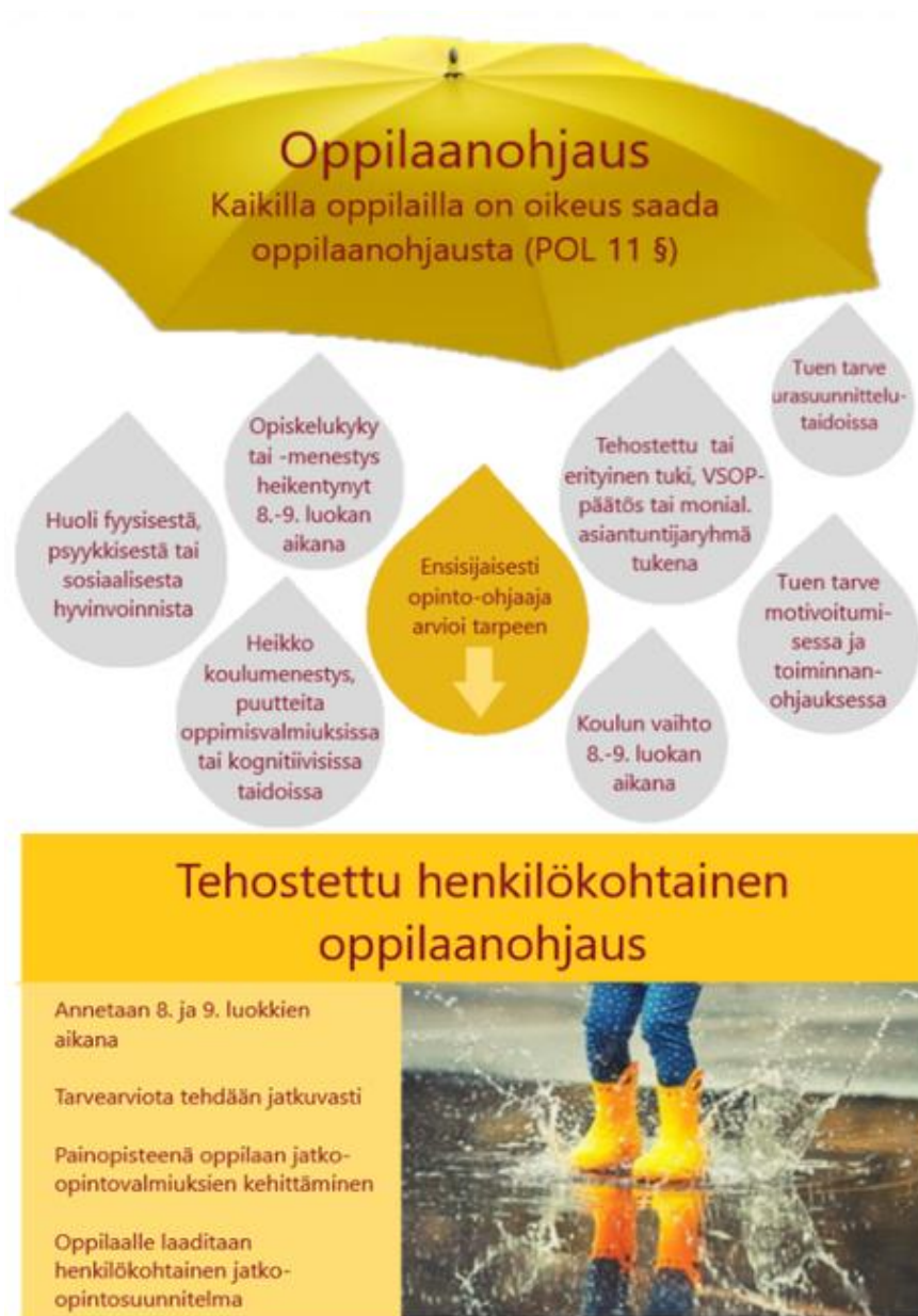
Kuva 3. Oppilaanohjaus ja tehostettuun oppilaanohjaukseen siirtyminen.

Ohjauksen sisältö ja toteutus laaditaan yksilöllisten lähtökohtien ja tarpeiden pohjalta, joten tehostettu henkilökohtainen oppilaanohjaus voi tarkoittaa eri oppilaille eri ohjauksen muotoja. Lähtökohtaisesti tehostettu henkilökohtainen oppilaanohjaus on sitä, että oppilas tapaa opinto-ohjaajaa pienryhmäohjauksissa tai henkilökohtaisissa ohjauksissa keskimääräistä useammin. Tehostetussa henkilökohtaisessa oppilaanohjauksessa edetään henkilökohtaisen jatko-opintosuunnitelman mukaan, ja siihen voi sisältyä esimerkiksi tutustumista jatko-opintopaikkoihin, useampia TET-jaksoja, moniammatillista yhteistyötä sekä tiivistä yhteistyötä huoltajien kanssa.