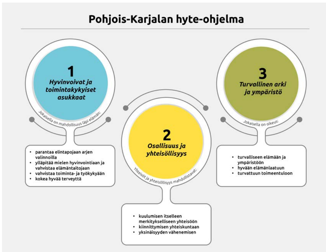
Kuva 3 Pohjois-Karjalan hyte-ohjelma. Painopisteet ja niiden tavoitteet.