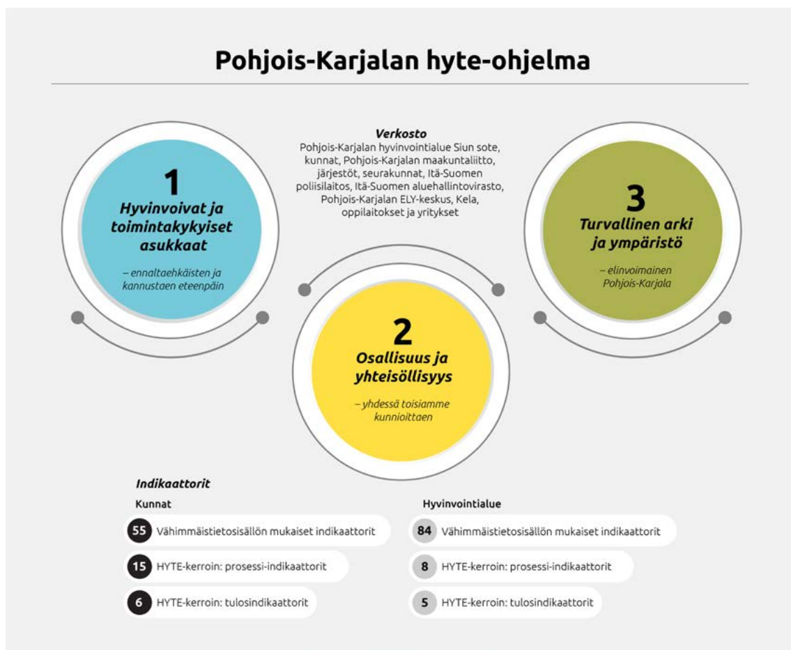
Kuva 1 Pohjois-Karjalan maakunnallisen hyte-ohjelman toimijaverkosto, painopisteet ja indikaattorit