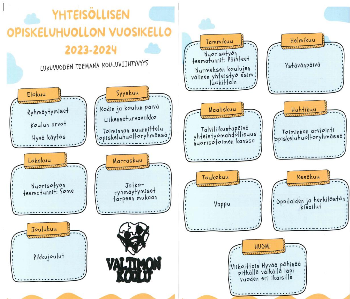
kuva 2. Valtimon koulun yhteisöllisen oppilashuollon vuosikello 2023–2024.

Koulumme oppilashuoltoa koordinoi yhteisöllinen oppilashuoltoryhmä. Oppilashuoltoryhmä kokoontuu joka kuukauden ensimmäinen tiistai. Oppilashuoltoryhmään kuuluu rehtori, opinto-ohjaaja, erityisopettaja, terveydenhoitaja, kouluvalmentaja, koulukuraattori sekä koulunkäynninohjaaja. Myös huoltajia ja oppilasjäseniä on kutsuttu osallistumaan ryhmän toimintaan. Lukuvuoden aluksi olemme laatineet vuosikellon toiminnan jäsentämiseksi (kuva 2.) Vuosikelloa täydennetään lukuvuoden aikana. Tämän vuoden teemana on kouluviihtyvyyttä.