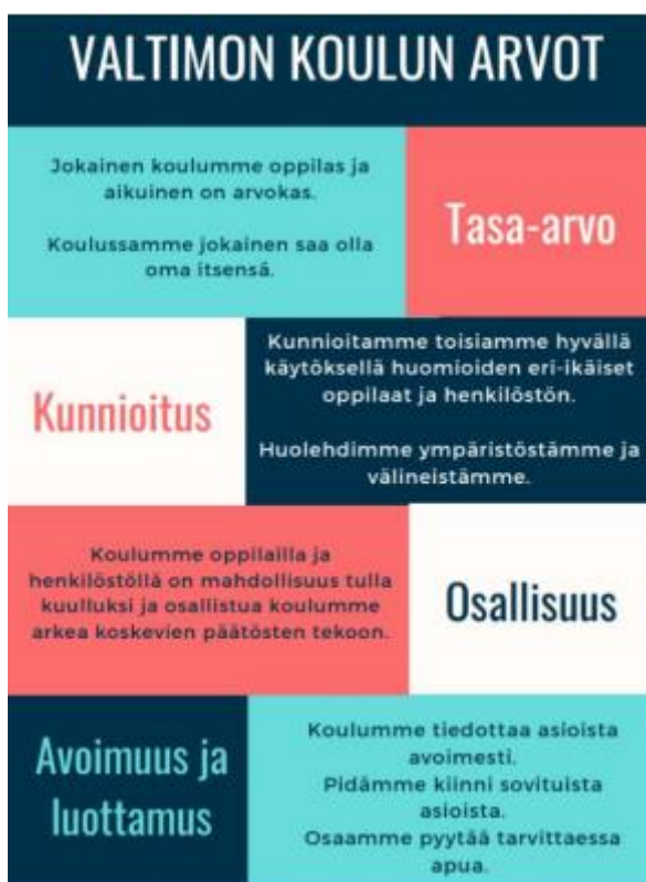
kuva 1. Valtimon koulun arvot

Koulumme toimintaa ohjaavat opetussuunnitelman ja muun yhteisen ohjeistuksen lisäksi kou- lumme arvot. Lukuvuoden 2024–2025 teemana on hyvinvointi.